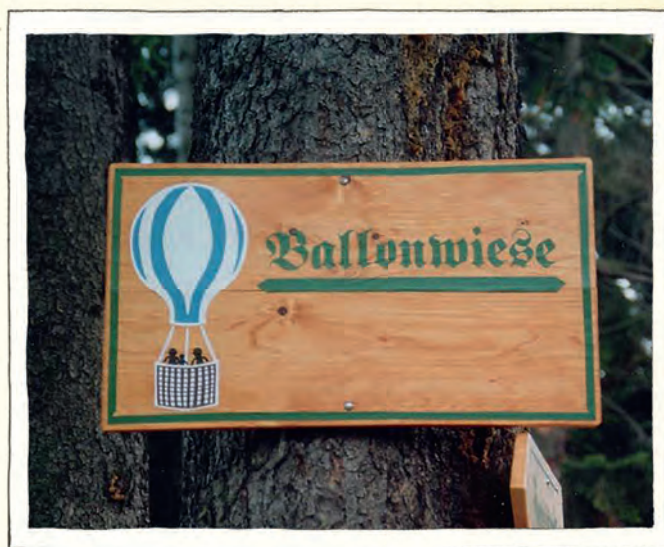
Un indicator din Bavaria care marchează locul în care a aterizat balonul