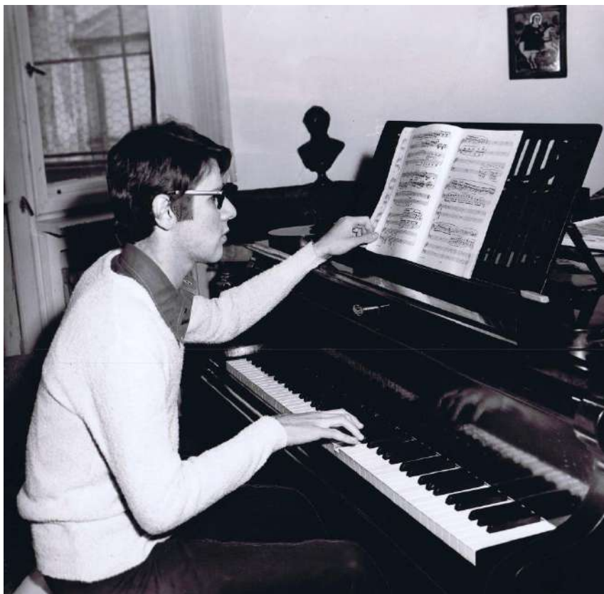
Februarie 1977, acasă, studiind Concertul nr. 1 de Brahms, foto de Ileana Muncaciu.