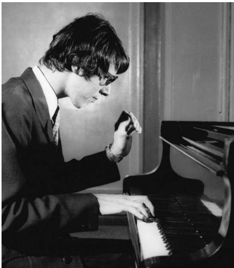
Repetiție la Atheneul Român.