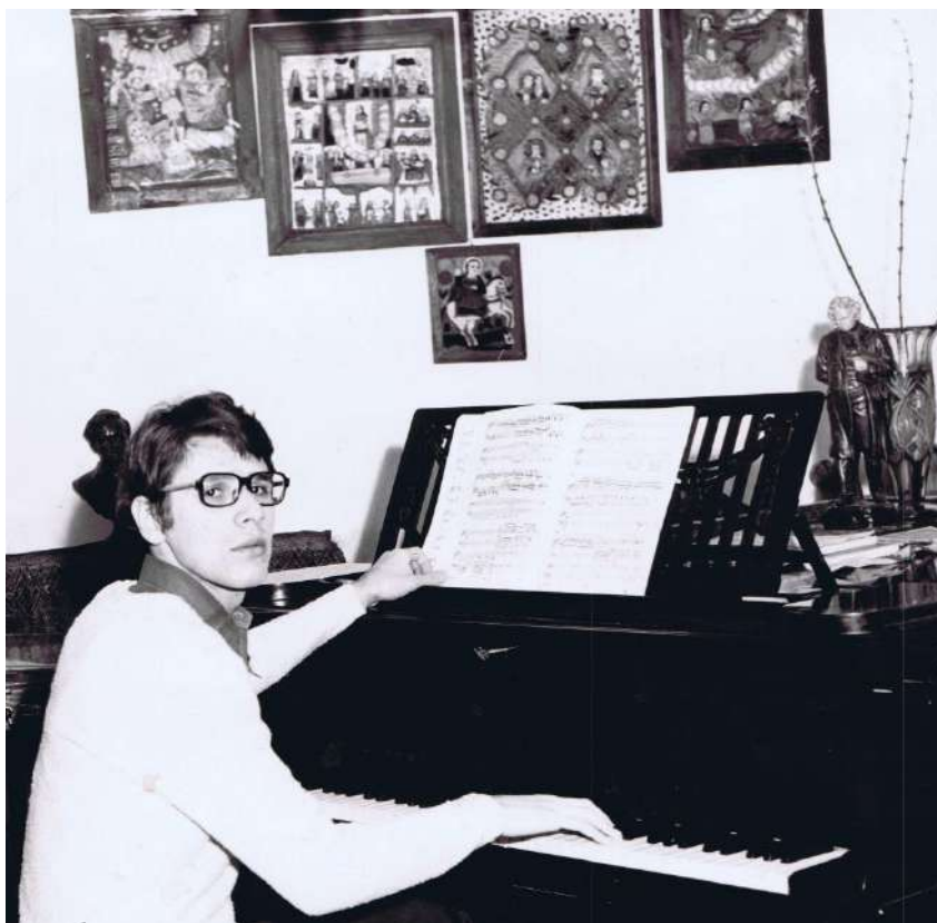
Februarie 1977, acasă, studiind Concertul nr. 1 de Brahms, foto de Ileana Muncaciu.