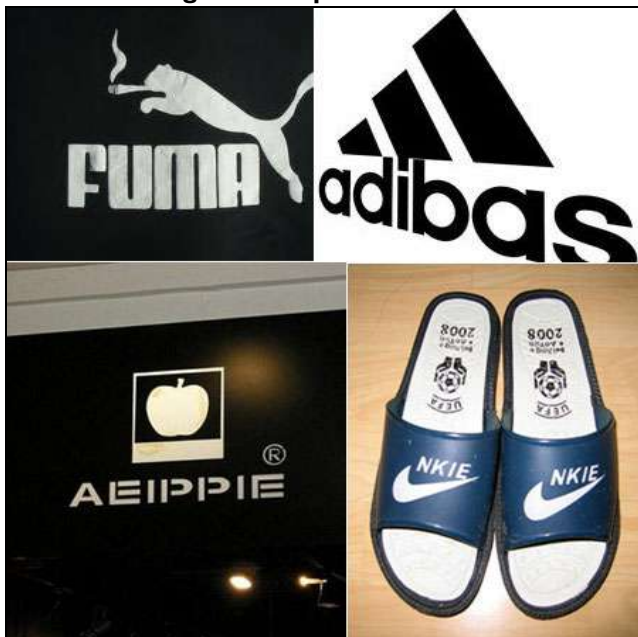
Fig. 1: Exemple de fake-uri

Internetul este un instrument comercial de o putere incomparabilă. În schimbul unui preț foarte mic, prin intermediul Internetului, orice comerciant poate să fie văzut de toți consumatorii care dețin un computer sau un telefon inteligent. Pentru copiatori, Internetul este văzut ca o armă nucleară suspendată deasupra caselor de lux. Cheltuielile caselor de lux au fost și sunt foarte mari pentru a realiza integrarea pe