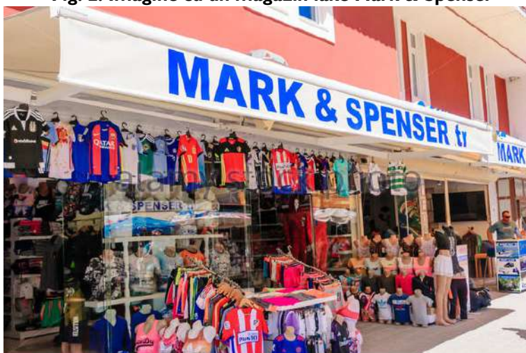
Fig. 2: Imagine cu un magazin fake Mark & Spenser

verticală, în sensul unui control total de la fabricarea produsului și până la distribuție, trecând prin gestiune și imagine. În plus, eforturile caselor de lux sunt uriașe în determinarea clienților să le treacă pragul magazinelor. Ținând cont de acestea, casele de lux consideră comerțul electronic un inamic al comerțului clasic.