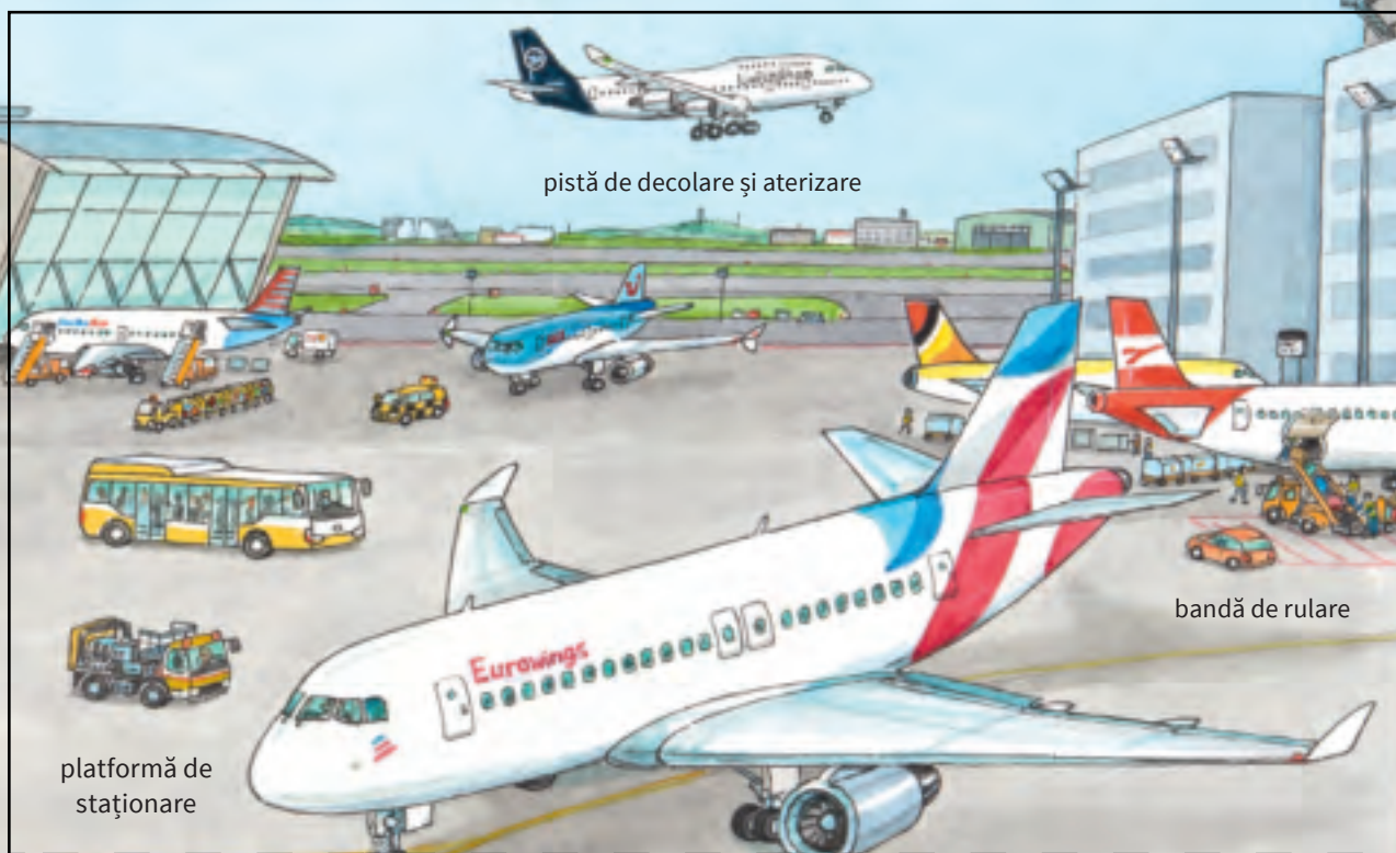
bandă de rulare