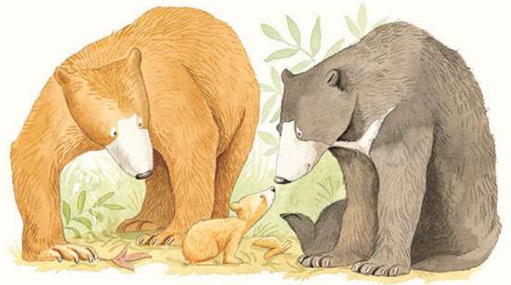
Și al treilea ursuleț.