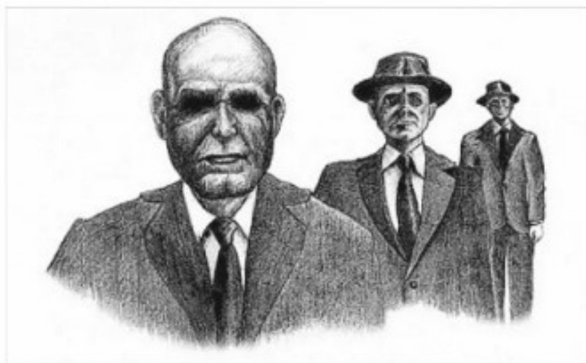
Fig. 3: Ilustrare a varietății stranii a MiB

guvernamentali, există un alt factor bizar în spatele MiB. Unele descrieri ale MiB îi prezintă ca bărbați cu aspect asiatic. Unii cred, prin urmare, că MiB sunt călugări tibetani care l-au urmat pe Dalai Lama în exil și și-au pus puterile psihice de yoghini în slujba CIA. Mulți MiB susțin că sunt reprezentanți ai „Națiunii Celui de-al Treilea Ochi”. Un contact MiB timpuriu a fost