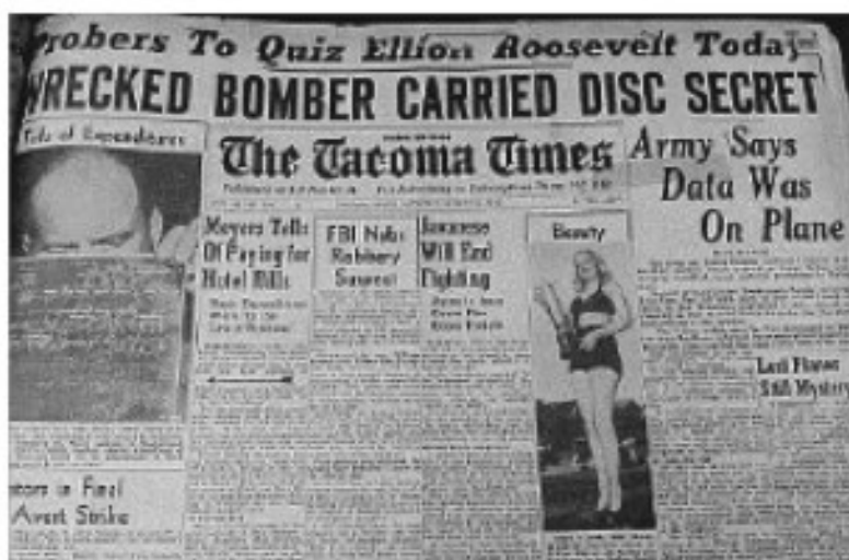
Fig. 4: Reportaj de ziar privind incidentul de pe insula Maury