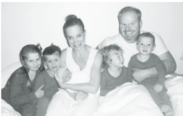
Țintuit la pat cu copiii.

trezit într-o stare asemănătoare. Prin urmare, am organizat un Maraton anual al Somnului prin care să ajut la strângerea de fonduri pentru cercetare. Dacă ți-ar plăcea să mă sponsorizezi, și eu sunt convins că ți-ar plăcea, te rog să donezi 100 de dolari pentru fiecare oră pe care o dorm. Tu vei face un mare serviciu umanitar iar eu voi fi un tată mai bun, mulțumită bunătății și sprijinului tău. Este o situație din care toată lumea câștigă. Îmi dau seama că asta lasă impresia că tu n-ai face decât să mă plătești pe mine ca să dorm, dar este mai mult de atât. Împreună, noi putem face ca acțiunea de a avea copii să fie mult mai suportabilă. Mă rog, mai suportabilă pentru mine și pentru contul meu bancar. Îți mulțumesc pentru generozitatea ta.