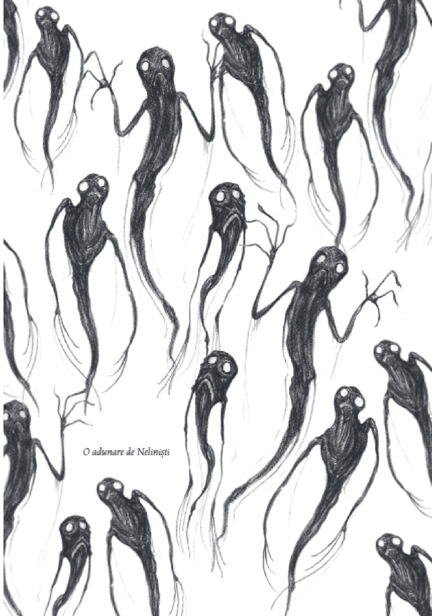
O adunare de Nelinisti