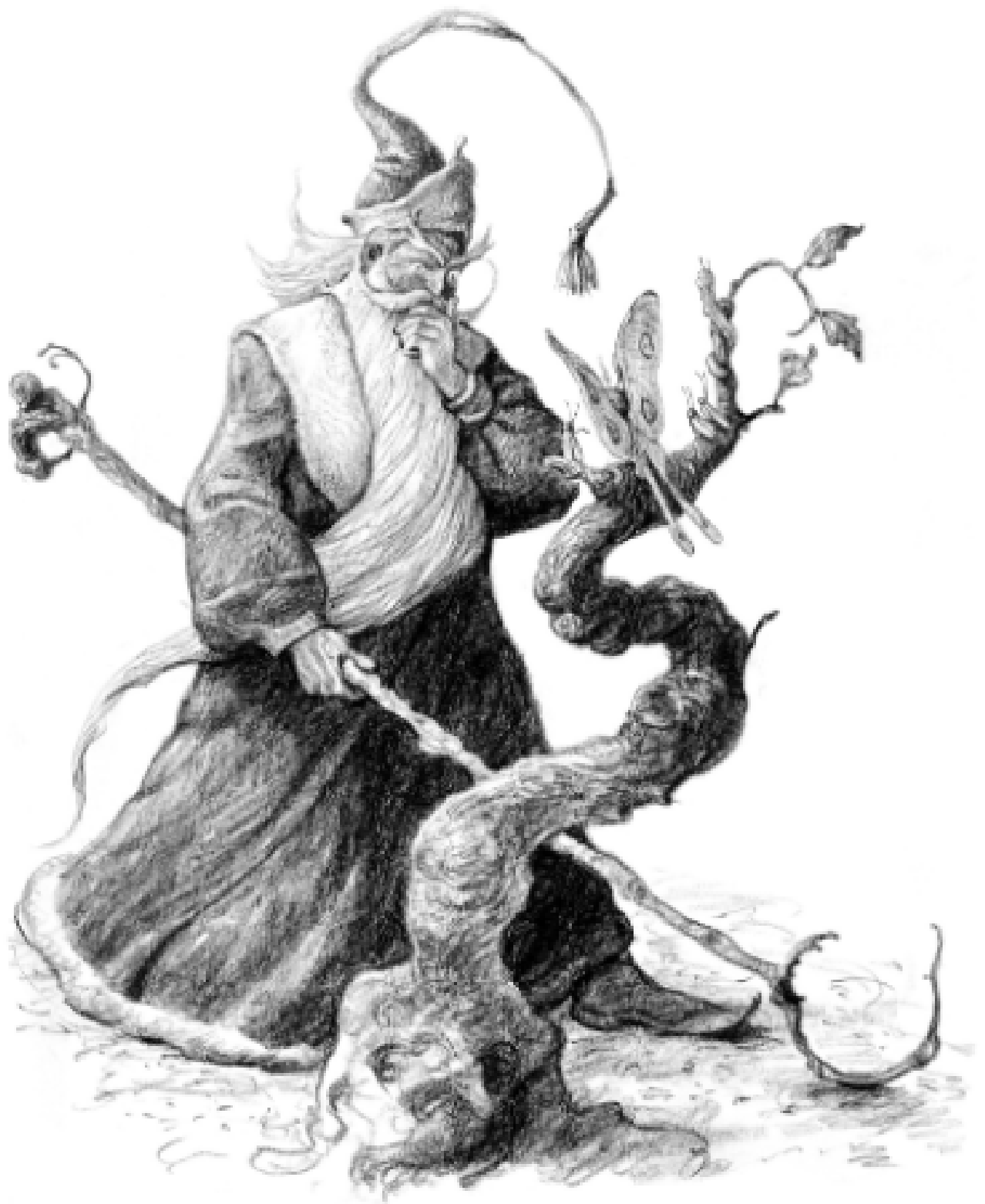
Ombic stă pe gânduri