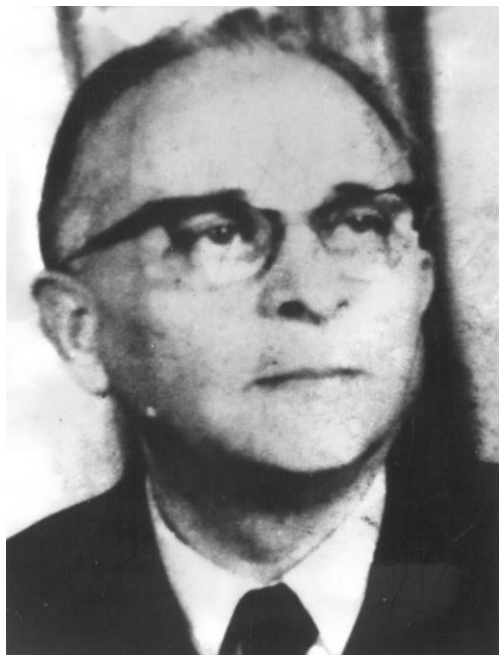
Actorul, regizorul și profesorul Alexandru Finți