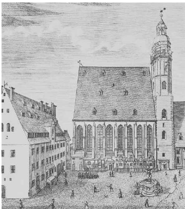
Școala și Biserica Sfântul Toma din Leipzig

amănuntele cele mai lipsite de însemnătate să rămână întipărite în mintea acelor care iubesc, așa că s-ar putea ca ultimul meu gând conștient să nu fie ziua nunții sau a nașterii primului nostru copil, ci clipa când a cântat fuga, cuprinzându-mă cu unul dintre brațele sale, sau când m-a sărutat pe pragul casei noastre din Leipzig.