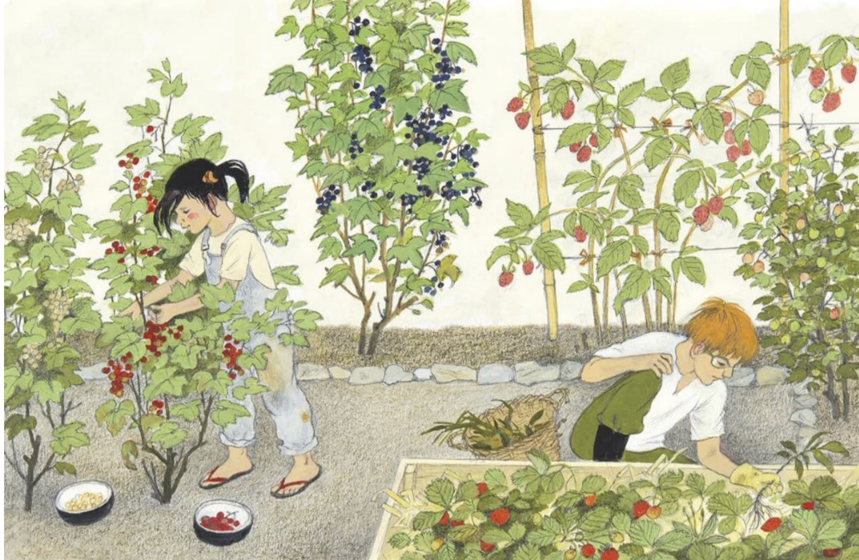
coacăze roșii și albe