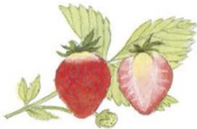
O căpșună și o jumătate de căpșună.