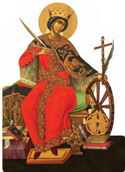
Sfânta Muceniță Ecaterina (287-305)

Moaștele ei se găsesc la Mănăstirea Sfânta Ecaterina din Sinai și este sărbătorită la 25 noiembrie.