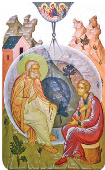
Sfântul Serafim din Sarov

Viețile Sfinților este una dintre cele mai îndrăgite cărți ortodoxe. Ea ne dezvăluie lucrarea minunată a harului Sfântului Duh, pe calea dobândirii sfințeniei. Alături de Sfânta Scriptură și de Pateric , ea a reprezentat întotdeauna un izvor de inspirație și de putere pentru creștini. Primele însemnări despre sfinți le avem chiar în Biblie. Sfintele Evanghelii, Faptele Apostolilor și Epistolele ne dezvăluie evenimente din viața ucenicilor Mântuitorului. Pe măsura trecerii timpului, oamenii au povestit și apoi au consemnat viețile altor sfinți pe care i-au cunoscut, pentru a fi pildă tuturor. Istorisirile minunate au încălzit sufletele credincioșilor și le-au aprins de râvnă pentru a le urma și a dobândi sfințenia.