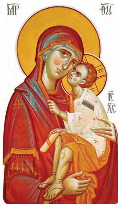
Maica Domnului cu Pruncul

Tu, Maica Domnului, ești locul tuturor harurilor, plinătatea a toată frumusețea și bunătatea, tablou și icoană însuflețită a tot binele și a toată bunătatea. (...)