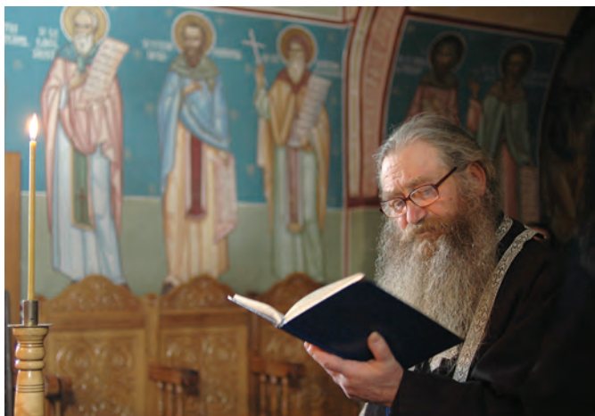
Preot călugăr la rugăciune

Spiritualitatea răsăriteană a adunat această experiență a iubirii frumuseții divine și a virtuții într-o culegere de scrieri care poartă numele de Filocalie . Cuprinde texte scrise de Sfinți Părinți care au avut o profundă cunoaștere a sufletului omenesc și a relației acestuia cu Dumnezeu, dobândită în liniștea pustiei sau a chiliei. Filocalia este o carte esențială în viața creștinilor, în special a monahilor. Ea deschide calea către o lucrare personală prin care omul urcă treptele frumuseții duhovnicești către Izvorul acesteia. Viața monahală pune în practică învățăturile Filocaliei , kalogeros (din care provine cuvântul „călugăr”) însemnând în limba greacă „bătrân frumos”.