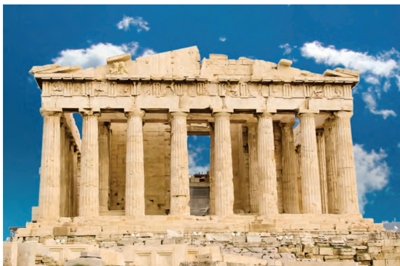
Partenonul, Atena (Grecia)

• Artiștii au remarcat în natură principiile estetice precum armonia, simetria și ordinea și le-au preluat, aplicându-le în artă. În Grecia antică, monumentele aveau la bază un canon, adică o măsură, raportată la dimensiunea omului (înălțime, lățime, pas, considerate invariabile), în funcție de care se calculau celelalte dimensiuni. Un exemplu remarcabil în acest sens este Partenonul, templu ridicat în cinstea zeiței Atena, ocrotitoarea cetății.