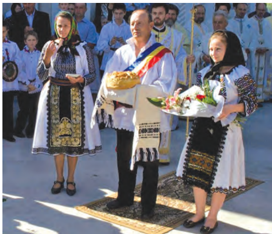
Primirea oaspeților cu pâine și sare, Libotin, județul Maramureș

Învățătura Sfântului Apostol Pavel este foarte actuală și poate fi asociată cu trăsătura specifică fiecărui popor al lumii: în Antichitate poporul grec era fascinat de filosofie, iar poporul roman de drept; poporul rus a cucerit prin literatură; poporul german s-a remarcat prin seriozitate și ordine; poporul japonez a considerat că respectul și meticulozitatea sunt calități deosebite, iar poporul român a transmis lumii o spiritualitate vie. Exemplele pot continua. Armonia lui Dumnezeu se reflectă în armonia creată de popoarele lumii, deși identitatea lor este diferită.