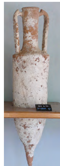
Amforă pentru măsurarea talanților

În Antichitate printre unitățile de măsură folosite pentru masă se număra și talantul. În Grecia antică un talant avea 26 kg, fiind echivalent cu masa de apă necesară pentru a umple o amforă. Există și o monedă cu acest nume.