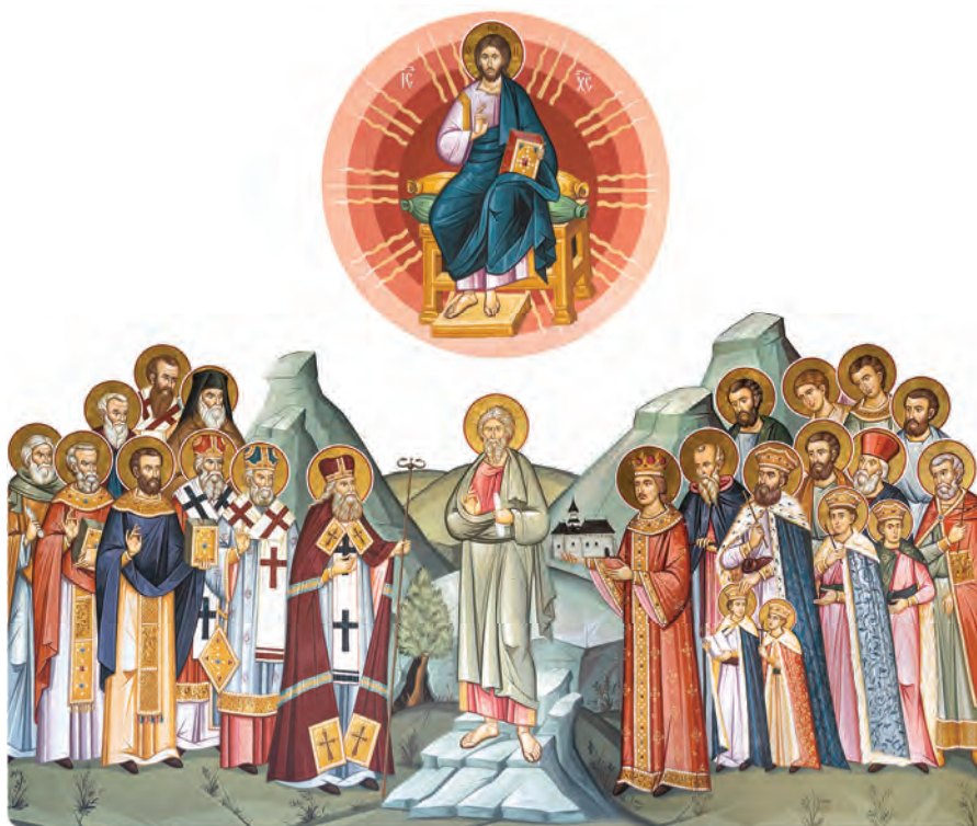
Icoana sfinților români