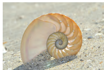
Cochilie de Nautilus

Șirul lui Fibonacci este constituit din numere a căror valoare este egală cu suma precedentelor două valori din serie: 0, 1, 1, 2, 3, 5, 8, 13, 21, 34... Aplicarea geometrică duce la o formă spirală armonioasă, des întâlnită în natură. De asemenea, numărul de petale al unor flori urmează acest șir extraordinar.