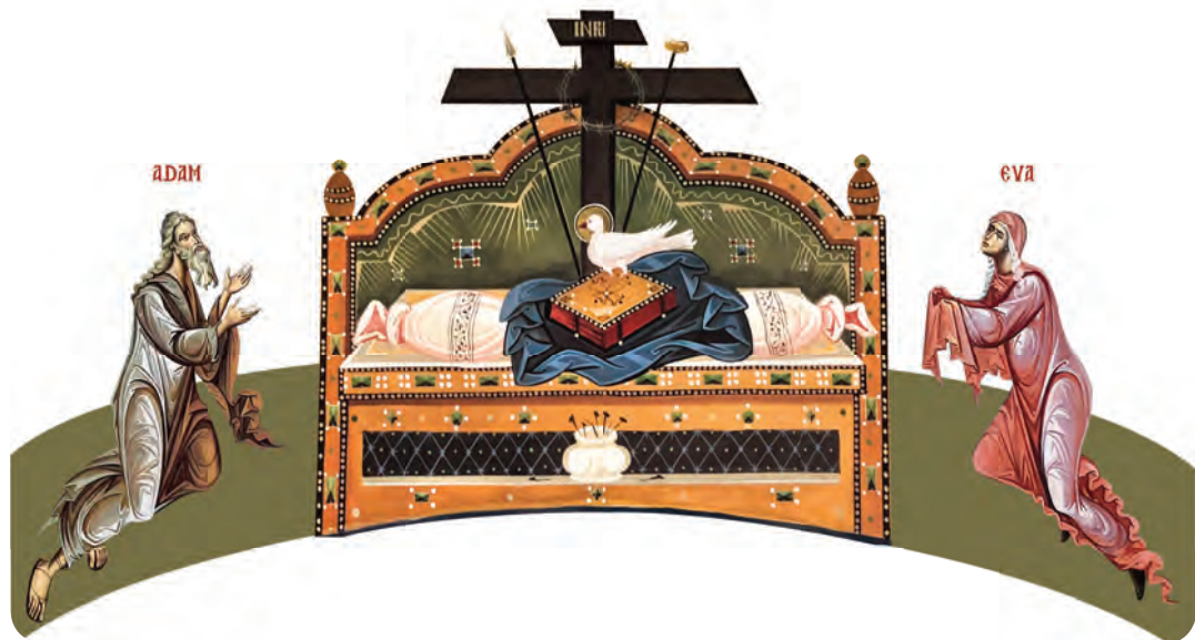
Tronul Hetimasiei (frescă, Mănăstirea Antim, București)