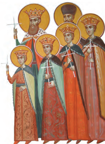
Sfântul Voievod Mucenic Constantin Brâncoveanu și fiii săi, Constantin, Ștefan, Radu, Matei, precum și Ianache sfetnicul sunt prăznuiți la 16 august.

Moaștele ei se găsesc la Mănăstirea Sfânta Ecaterina din Sinai și este sărbătorită la 25 noiembrie.