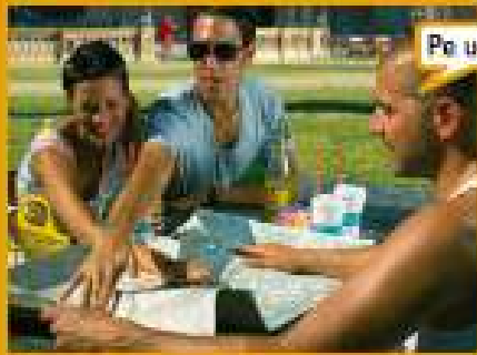
Pe unde mergem?