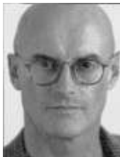
Kenneth Earl Wilber II (born 1949) Integral Institute The Spectrum of Consciousness (1977)