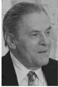
Stanislav Grof (born-1931) Esalen Institute, California Holotropic Breathwork: A New Approach to Self-Exploration and Therapy (2010)