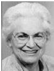
Jane Loevinger Weissman (1918–2008) Washington University Paradigms of Personality (1987)