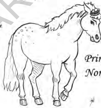
Prințesa Nor Alb