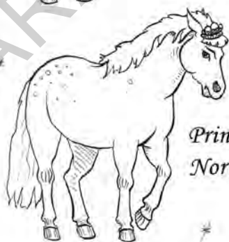
Prințesa Nor Alb