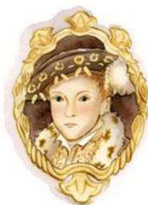
Edward al VI-lea

Mark Twain a fost un celebru scriitor american, care a trăit acum mai bine de o sută de ani. Povestea Prinț și cerșetor a fost scrisă în 1882, deși întâmplarea relatată se petrece mult în trecut, în 1547. Pentru prințul din poveste, Twain s-a inspirat de la Edward al VI-lea, care a fost un rege copil. Edward avea nouă ani când, după moartea tatălui său, Henric al VIII-lea, a devenit Regele Angliei și Irlandei. Edward nu a domnit decât cinci ani și jumătate, pentru că la 15 ani a murit din cauza unei boli de plămâni.