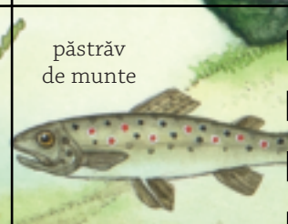
păstrăv de munte