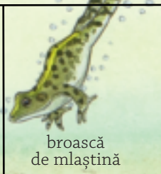
broască de mlaștină