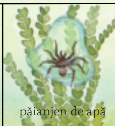
păianjen de apă