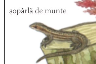
șopârlă de munte