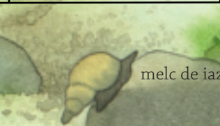
melc de iaz