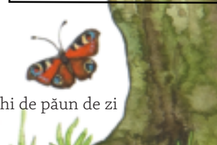
ochi de păun de zi