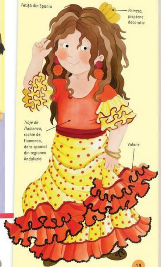
Peineta, pieptene decorativ