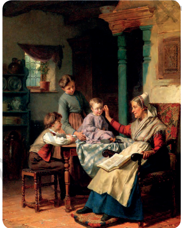
Încercând ochelarii bunicii , Théodore Gérard (1829–1902)