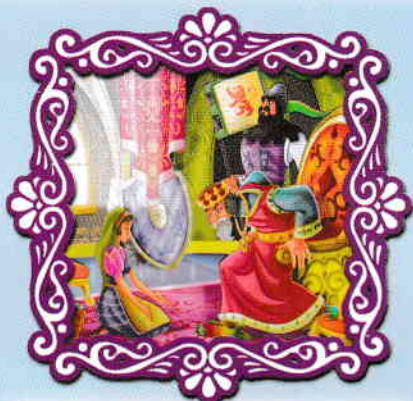
Fata cu părul de aur