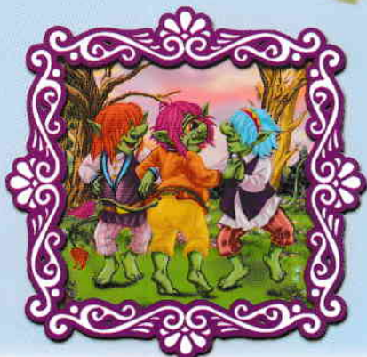
Trollii din pădurea hedalenă