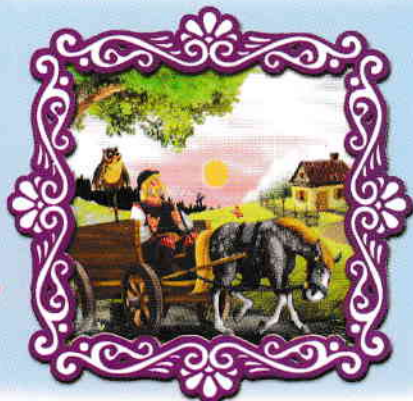
Bufnița cea văzătoare și atoateștiutoare