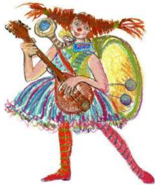
CLOVNIȚA LIȚA (nepoata clovnului bătrân)