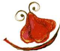
CLOVNI ȘI CLOVNIȚE