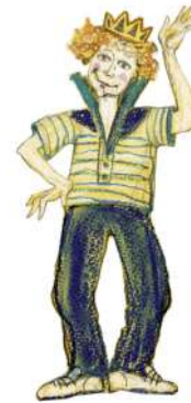
PRINȚUL (nepotul regelui)