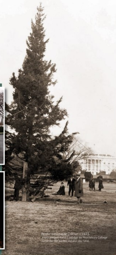
Bradul național de Crăciun - 1923. Căruța prezidențială. Colegiul de Măslăbură College Căruța din parcul statului său natal.