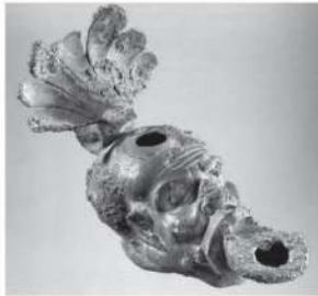
1. Lămpile de mici dimensiuni, în forme de capete (sau picioare) umane, erau considerate șic în secolul I e.n. Aici, uleiul se turna prin gaura din fruntea personajului și flacăra îi ardea prin cea de la gură. Cu tot cu petalele care formează mânerul, lampa avea o lungime de numai 12 centimetri.

unui Numerius Herennius Celsus. La doar 22 de ani (cum încă se mai poate citi inscripționat în piatră), aceasta trebuie să fi avut, ca vârstă, nici jumătate din anii soțului ei bogat, membru al uncea dintre cele mai prestigioase familii pompeiene, care fusese ofițer în armata romană și de două ori ales în cea mai înaltă funcție a guvernării urbane locale.