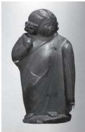
3. Vreo posesiune prețioasă a cuiară? Figurina de față, făcută din chihlimbar de culoare roșie de la Marca Baltică și reprezentând o persoană îndesată, a fost găsită la unul dintre fugarii ghinioniști. Având numai 8 centimetri înălțime, probabil că era menită să înfățișeze unul dintre personajele caracteristice ale mimici romane, distracție foarte răspândită la Pompeii (v. pagina 302).