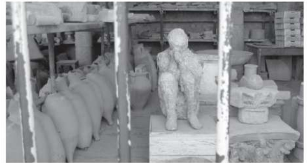
2. Mulajele de ghips făcute după trupurile victimelor ne reamintesc de umanitatea lor — că erau niște oameni, adică, exact ca noi. Acest mulaj memorabil, înfățișând un om aflat în pragul morții, cu capul prins între mâini, a fost așezat la păstrare într-un spațiu de depozitare al sinului arheologic. În prezent, pare să-și deplângă prizonieratul.

Câțiva din acest al doilea grup au ajuns ceva mai departe față de perechea dinaintea lor. Vreo cincisprezece au ajuns până la următorul monument grandios de pe marginea drumului, situat la o distanță de douăzeci de metri — mormântul lui Marcus Obellius Firmus — când au fost spulberați de ceea ce astăzi denumim „răbufnirea piroclastică“ a muntelui Vezuviu, o combinație ucigătoare, incandescentă, de gaze, resturi vulcanice și rocă topită, care circula cu o viteză amețitoare și din fața căreia nimeni și nimic n-ar fi putut scăpa. Trupurile lor au fost găsite, unele, contopite cu niște crengi de care păreau să se țină încă. Poate că aceia mai agili dintre membrii grupului se refugiaseră lângă arborii din jurul mormintelor, într-o încercare deznădăjduită de-a se salva; mai probabil este, însă, că valul piroclastic de la care li s-a tras moartea fugarilor a și prăvălit peste ei copaci aduși din amonte.