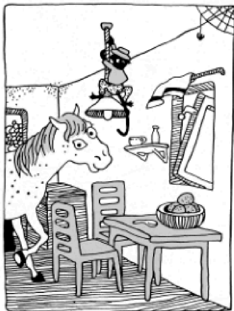
Așa arăta în Vila Villekulla.

Bine, treaba era că n-avea cine să-i spună să meargă să se culce seara. Dar Pippi găsisese ea o metodă bună – se trimitea singură la culcare! Uneori nu înainte de zece, fiindcă Pippi n-a fost niciodată de părere că un copil trebuie musai să se culce la ora șapte. Doar atunci se distra cel mai bine. Și de-asta străinul n-avea de ce să se mire că Pippi se plimba prin grădină după apusul soarelui, când se lăsase deja răcoarea nopții, iar Tommy și Annika dormeau tun de mult