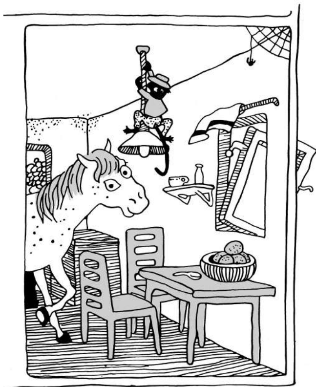
Așa arăta în Vila Villekulla.

Bine, treaba era că n-avea cine să-i spună să meargă să se culce seara. Dar Pippi găsisese ea o metodă bună – se trimitea singură la culcare! Uneori nu înainte de zece, fiindcă Pippi n-a fost niciodată de părere că un copil trebuie musai să se culce la ora șapte. Doar atunci se distra cel mai bine. Și de-asta străinul n-avea de ce să se mire că Pippi se plimba prin grădină după apusul soarelui, când se lăsase deja răcoarea nopții, iar Tommy și Annika dormeau tun de mult