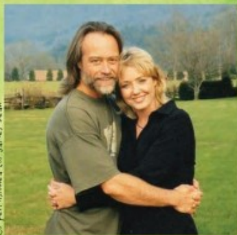
Cu permisiunea lui James Dean

iau loc la masă și încep să lucreze împreună la o poveste pentru copii. Visul lor a devenit realitate când au publicat Pete Motanul și ochelarii săi magici . La sfârșitul anilor 1990 au renunțat amândoi la joburi (James era inginer electronist; Kimberly lucra la biroul de presă al guvernatorului din Georgia) ca să se dedice pasiunii pentru artă. De atunci viața lor a devenit o înșiruire ciudată și minunată de coincidențe. Pete Motanul a adus magie în viețile lor. Cei doi lucrează cot la cot în Savannah, alături de cinci pisici și un câțel pe nume Emma.