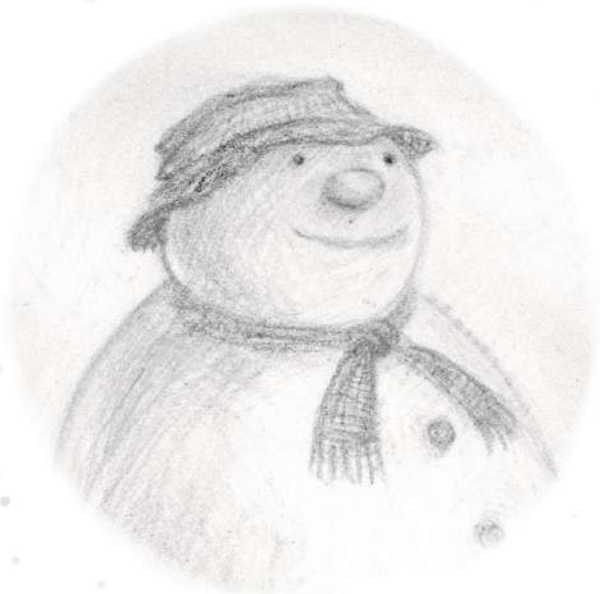
Omul de zăpadă