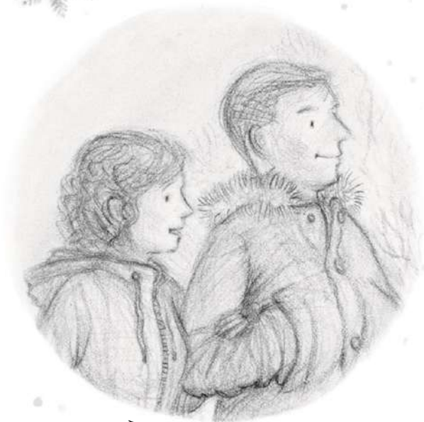
Mama și tata