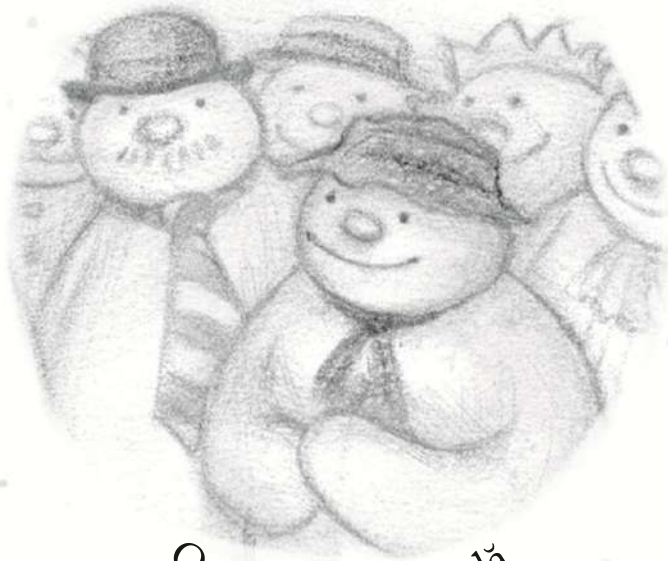
Oamenii de zăpadă