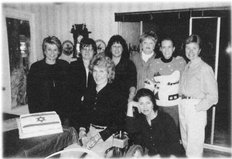
Femeile care mă ajută să mă scol și să-mi fac exercițiile dimineața

Credința face real ceea ce este nevăzut și atunci ce este vizibil devine mai puțin important.