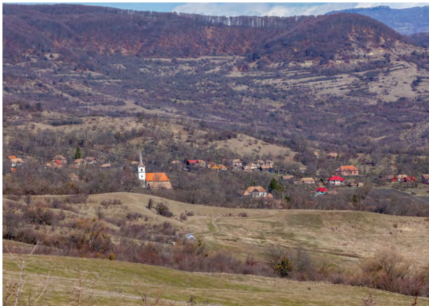
Medişoru Mare, aşezare submontană, scaunul Odorhei, județul Harghita.