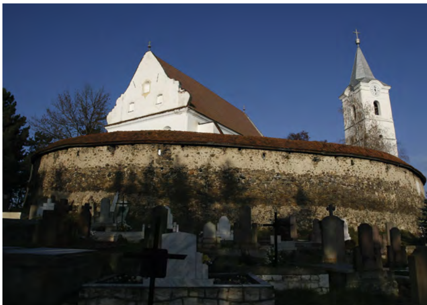
Biserica fortificată de la Cârța, secolul al XV-lea, scaunul Ciuc (Harghita).