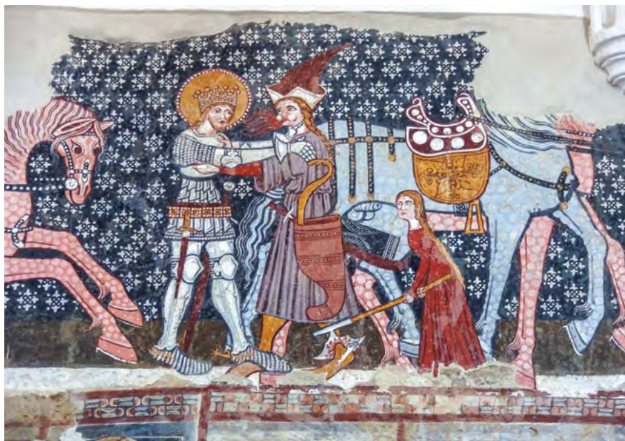
Legenda Sfântului Ladislav (detaliu), 1419. Biserica unitariană de la Dârjiu.