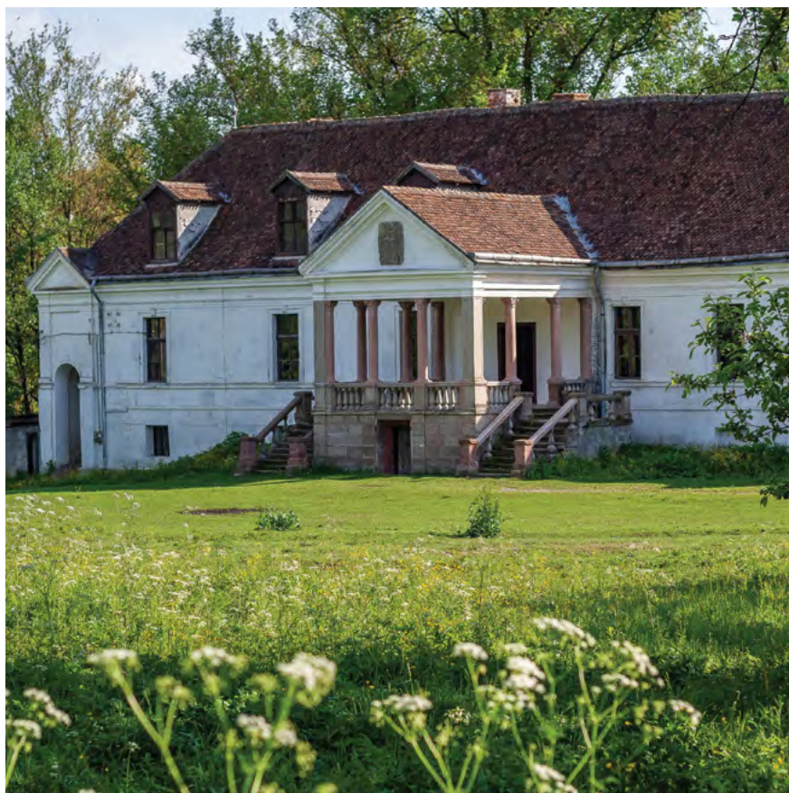
Conacul Kálnoky din Micloșoara, secolele XVII–XIX, Trei Scaune, județul Covasna.