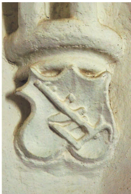
Reprezentări de plug, sfârșitul secolului al XV-lea, Dârjiu (Harghita). (Foto: Elek Benkő; reprodusă în Benkő, 2016, p. 256)