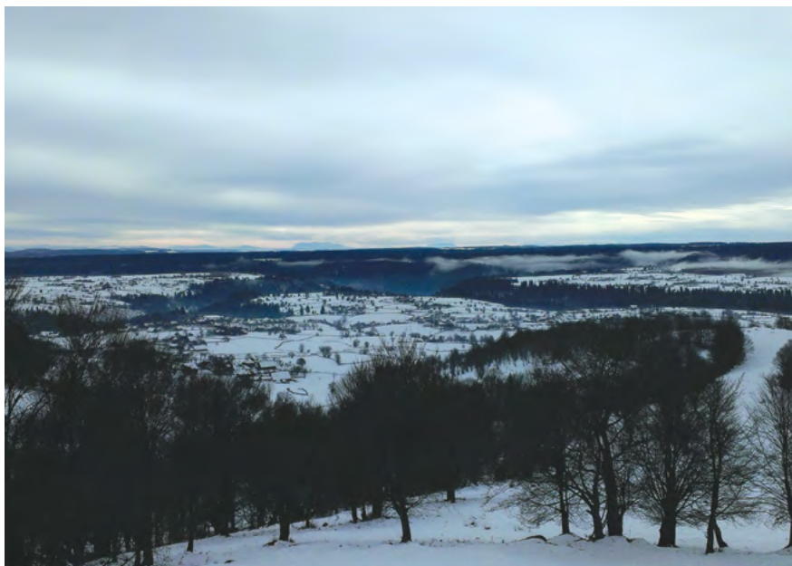
Vărşag, aşezare montană de pe platoul Harghitei.