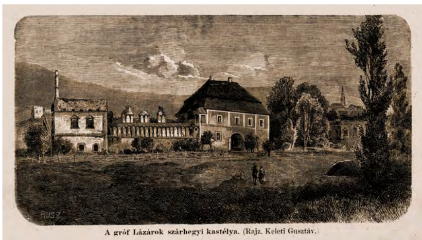
A gróf Lázárók szárhegyi kastélya. (Rajz. Keleti Gusztáv.)

Gusztáv Keleti, Castelul Lázár de la Lázareva . Castelul se afla în scaunul filial Giurgeu, azi în județul Harghita. (Gravură reprodușă în Orbán, 1868–1872, vol. II, p. 114)