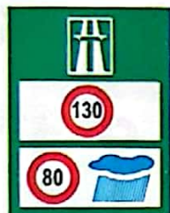
Limite maxime de viteză pe autostradă în funcție de condițiile meteorologice