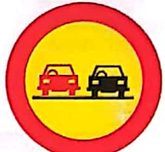
Depășirea autovehiculelor, cu excepția motocicletelor fără ataș, interzisă