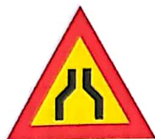
Drum îngustat pe ambele părți