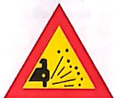
Împroșcare cu pietriș