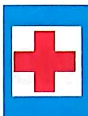
Post de prim-ajutor