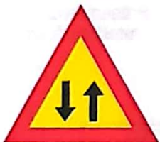
Circulație în ambele sensuri