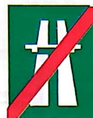
Sfârșit de autostradă