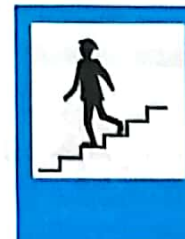
Pasaj subteran pentru pietoni