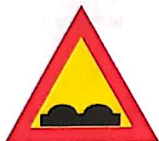
Drum cu denivelări