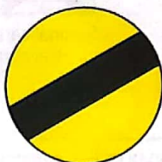
Sfârșitul tuturor restricțiilor