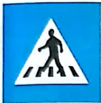
Trecere pentru pietoni

De obicei au formă dreptunghiulară (sau pătrată) și fondul albastru (sau verde).