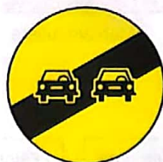
Sfârșitul interzicerii de a depăși