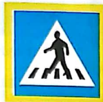
Trecere pentru pietoni