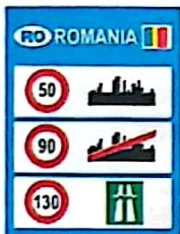
Limite generale de viteză