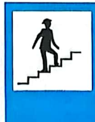
Pasarelă pentru pietoni