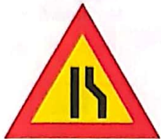
Drum îngustat pe partea dreaptă