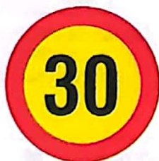
Limitare de viteză