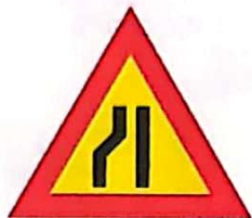
Drum îngustat pe partea stângă