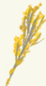
PANĂ DE COCOSTÂRC VERDE

PENELE DE TIP PUF sunt întâlnite la cocostârci, bătlani, egrete și papagali. Vârfulurile acestor pene se descompun într-un fel de pudră, pe care păsările o folosesc pentru a-și curăța și impermeabiliza penele și pentru a le menține apte de zbor.