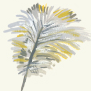
PANĂ DE QUICALUS

PENELE FILIFORME seamănă cu părul și sunt situate la baza penelor de contur. Oamenii de știință cred că penele acestea ajută pasărea să simtă schimbările de vânt și de presiune atmosferică. De asemenea, ele ajută penele de contur să rămână bine fixate.