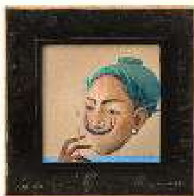
Capitolul 10 ulei pe pânză 49,5 x 49 cm 2019 / 2020