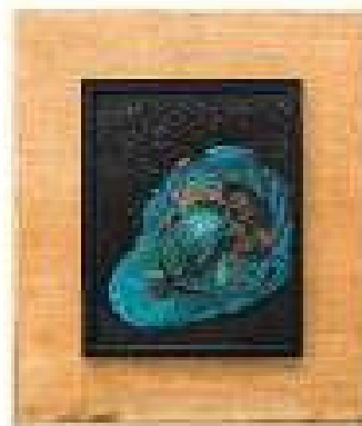
Capitolul 16 ulei pe pânză 53,5 x 47 cm 2019 / 2020