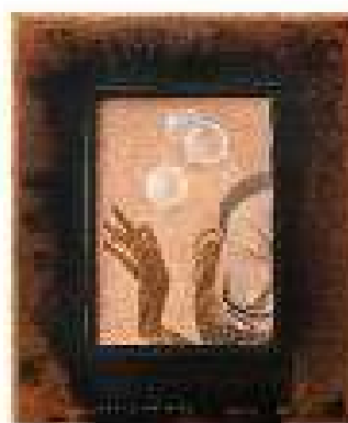
Capitolul 15 ulei pe pânză 54,5 x 45,5 cm 2019 / 2020