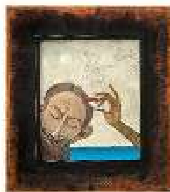
Capitolul 14 ulei pe pânză 61,5 x 55 cm 2019 / 2020