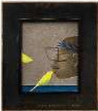
Capitolul 2 ulei pe pânză 55 x 60 cm 2019 / 2020