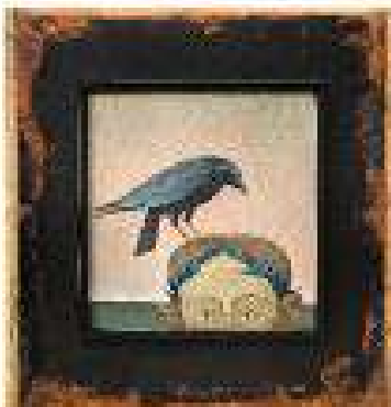
Capitolul 3 ulei pe pânză 61,5 x 59,5 cm 2019 / 2020