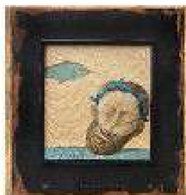
Capitolul 13 ulei pe pânză 61,5 x 59,5 cm 2019 / 2020