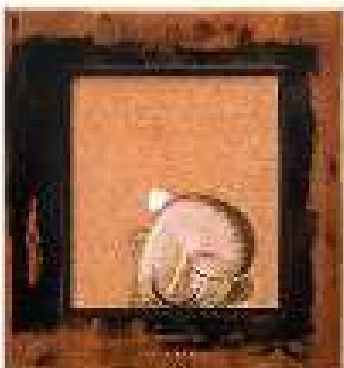
Capitolul 4 ulei pe pânză 62 x 57,5 cm 2019 / 2020