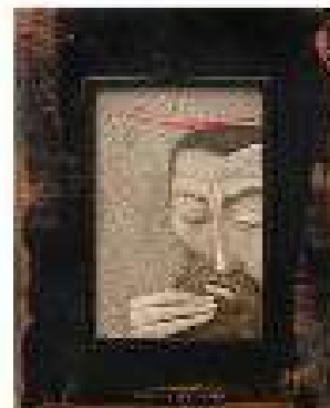
Capitolul 8 ulei pe pânză 58 x 45,5 cm 2019 / 2020