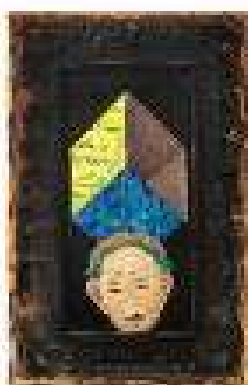
Capitolul 11 ulei pe pânză 78 x 51,5 cm 2019 / 2020