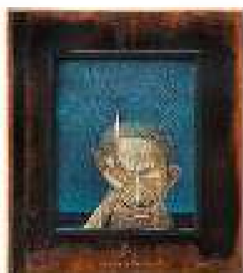
Capitolul 9 ulei pe pânză 62 x 55 cm 2019 / 2020