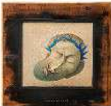
Capitolul 1 ulei pe pânză 61,5 x 58 cm 2019 / 2020