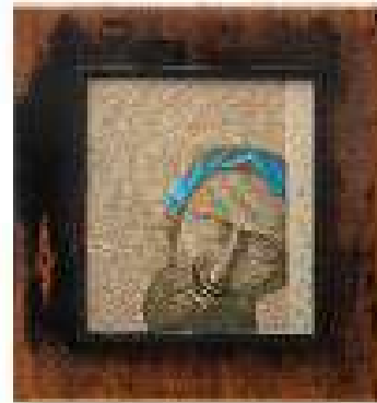
Capitolul 5 ulei pe pânză 58 x 61,5 cm 2019 / 2020