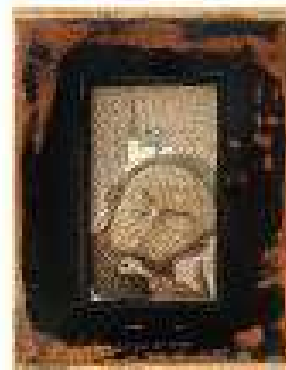
Capitolul 7 ulei pe pânză 60 x 46 cm 2019 / 2020