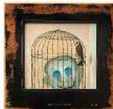
Capitolul 6 ulei pe pânză 61,5 x 57,5 cm 2019 / 2020