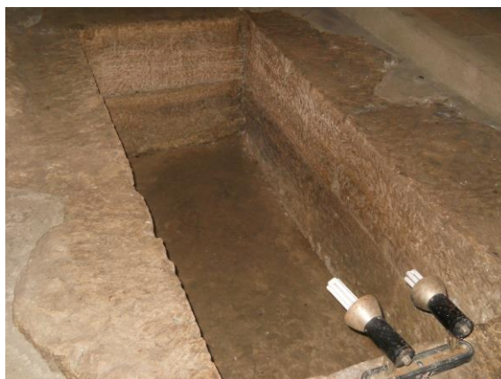
Mormântul în care a fost descoperit papirusul