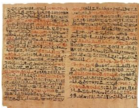
Papirusul de la Mangalia se întoarce de la Moscova