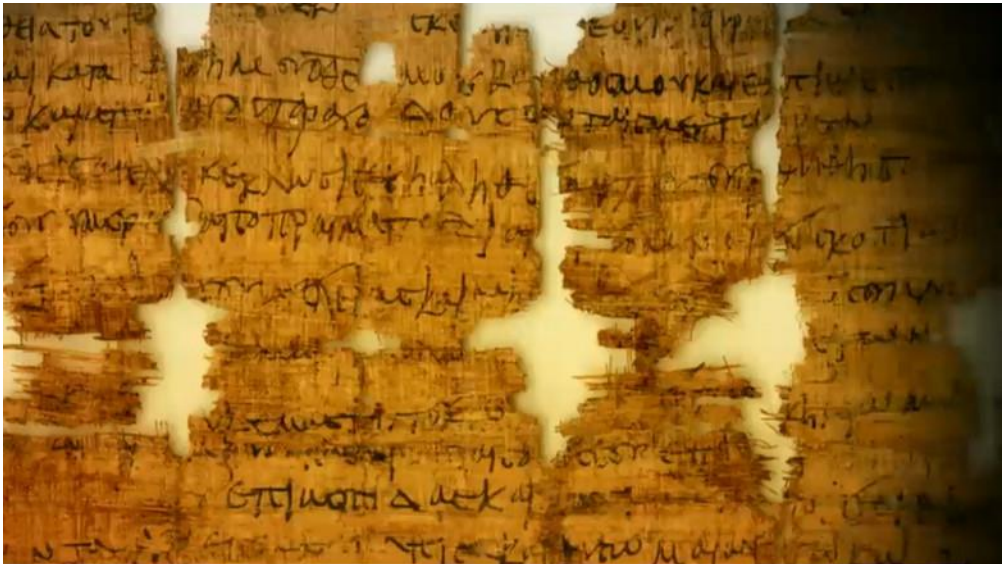
Papirusul de la Mangalia

cuvântul Evangheliei”, cum spune scriitorul Tertulian PE LA ANUL 220 (Manual pentru clasa a IV-a secundară, Istoria Bisericii Ortodoxe Române, Ediția I, 1946, p. 11). De acum avem deja mărturii ale scriitorilor bisericești, inscripții și obiecte paleocreștine, cum sunt și cele din Ardeal, Oltenia și Dobrogea: Biertan cu tăblița votivă, Sucidava (Celei - Corabia, unde Constantin cel Mare a construit podul peste Dunăre, în expediția împotriva goșilor de la nord și sud de Dunăre), sau Desa - Calafat (cu tumulii cu schelete umane din timpul migrației indo-europene) și Răcari-Dolj și, mai ales, în centrele urbane ale „Sciției Mici” ( Scythia Minor ). De curând a ajuns publică și informația Papirusului de la Mangalia din secolul IV î.Hr, perioada elenistică, descoperit pe un șantier de lucrări pentru sistematizare a acestui oraș, în anul 1959. Se susține că din aceeași perioadă s-a descoperit unul și la Derveni în Grecia, ambele fiind scrise în greaca veche. Papirusul nostru a fost trimis la Moscova pentru restaurare și descifrare, întrucât noi nu am avut tehnologia respectivă, rușii terminând restaurarea în 1961. În anul 2000 „ne-am adus aminte” de el și l-am cerut rușilor și, prin demersuri repetate ne-a fost returnat la 22 august 2011, fiind depus la muzeul din Mangalia.