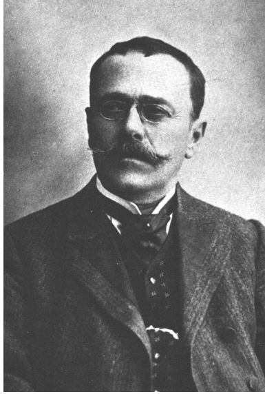
ION LUCA CARAGIALE (1852–1912)