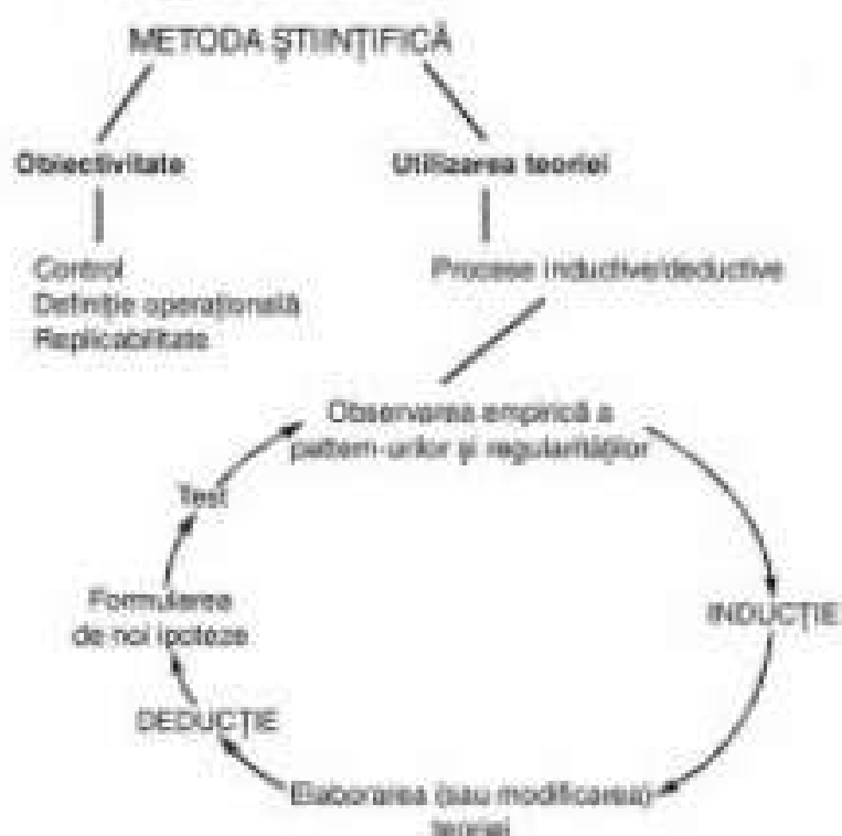
Fig. 4.3. Ciclurile teoriilor psihologice

realității care, la rândul lor, se subordonează unor perspective de abordare general-teoretică a realității, în care își găsesc expresia aspectele metodologice. Teoria psihologică „este un sistem general elaborat în vederea explicării principiilor ce stau la baza comportamentului” (Malim și Birch, 1998, p. 62). Procesele de achiziționare a cunoașterii psihologice conduc direct la construirea teoriilor. Practic, cercetarea (cunoașterea) și teoria se stimulează reciproc prin procesele de inducție și deducție. Inducția, ca prim pas în construirea cunoașterii, implică elaborarea teoriilor din observarea regularităților faptelor și datelor empirice, ea fiind condensată și integrată într-un tot coerent. Deducția presupune derivarea enunțurilor testabile din teorie. Procesele inductive/deductive sunt ciclice și se autoperfecționează. Ciclurile teoriilor psihologice sunt ilustrate în figura 4.3.