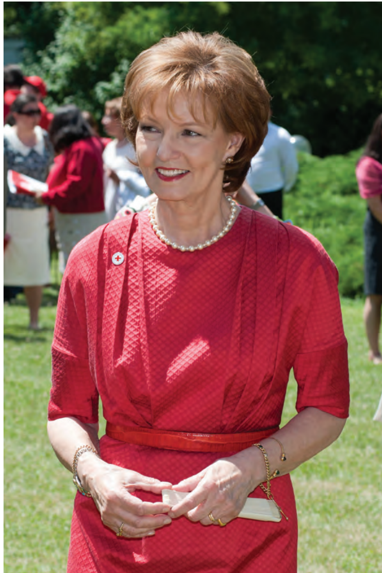
Ceremonie dedicată Societății Naționale de Cruce Roșie.