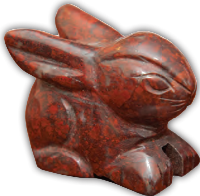
Miniatură de jasp din colecția Majestății Sale.