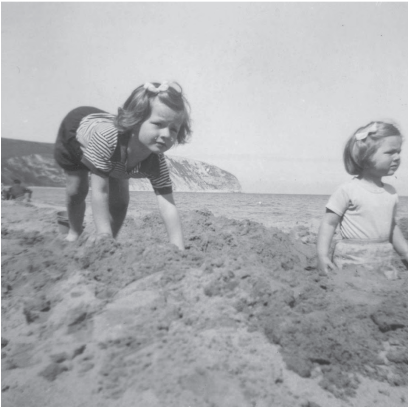
Majestatea Sa împreună cu Principesa Elena, Anglia, anii 1950.