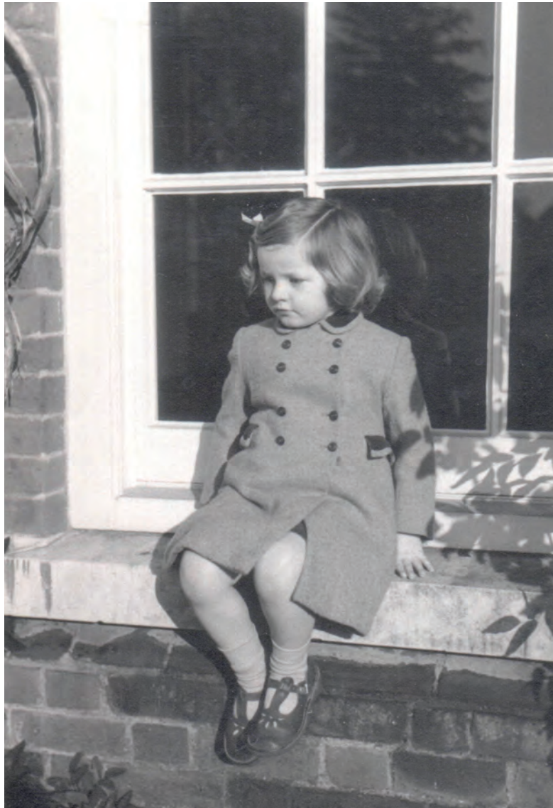
Ayot St. Lawrence, Anglia.