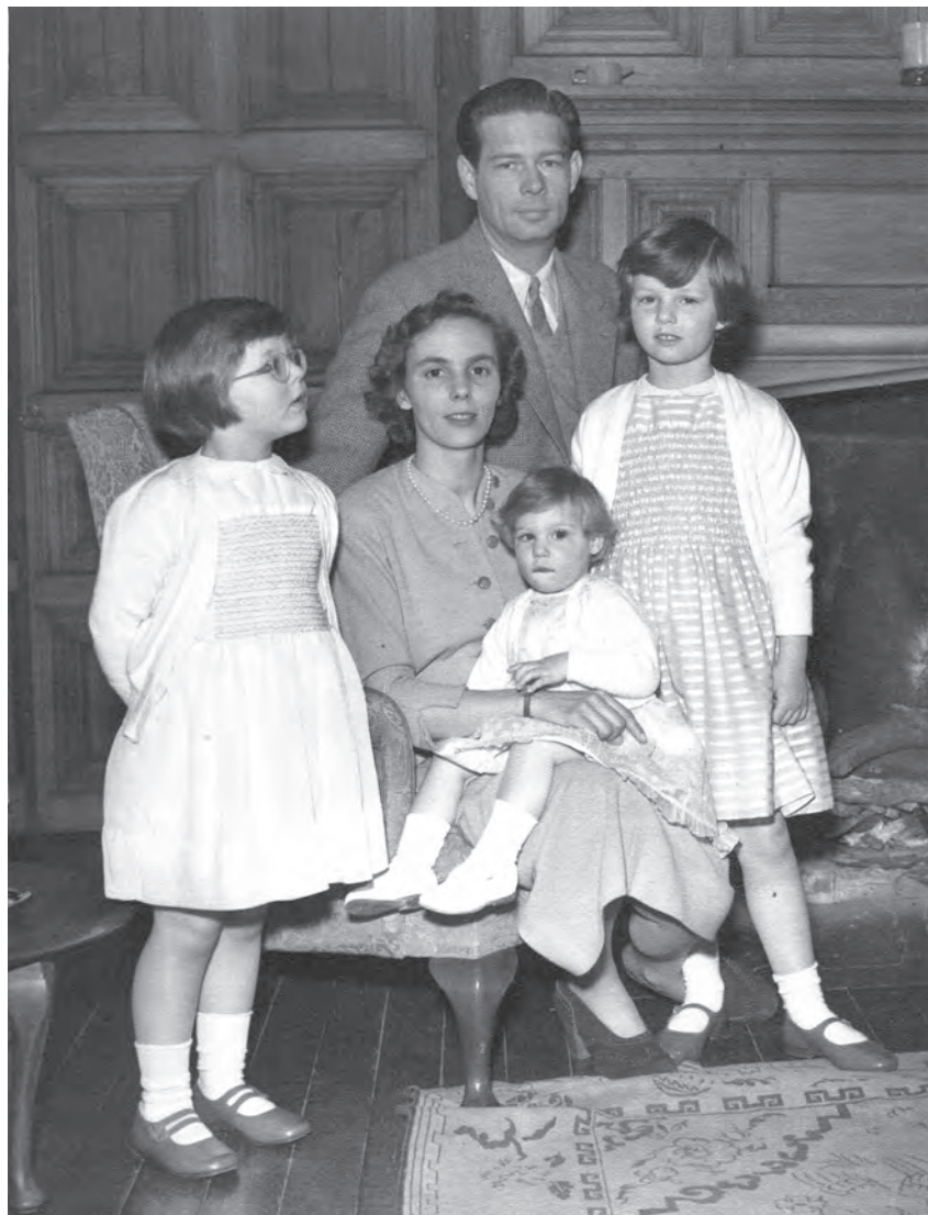
Custodele Coroanei, Principesa Elena și Principesa Irina împreună cu Regele Mihai și Regina Ana, Ayot St. Lawrence, Anglia, 1955–1956.