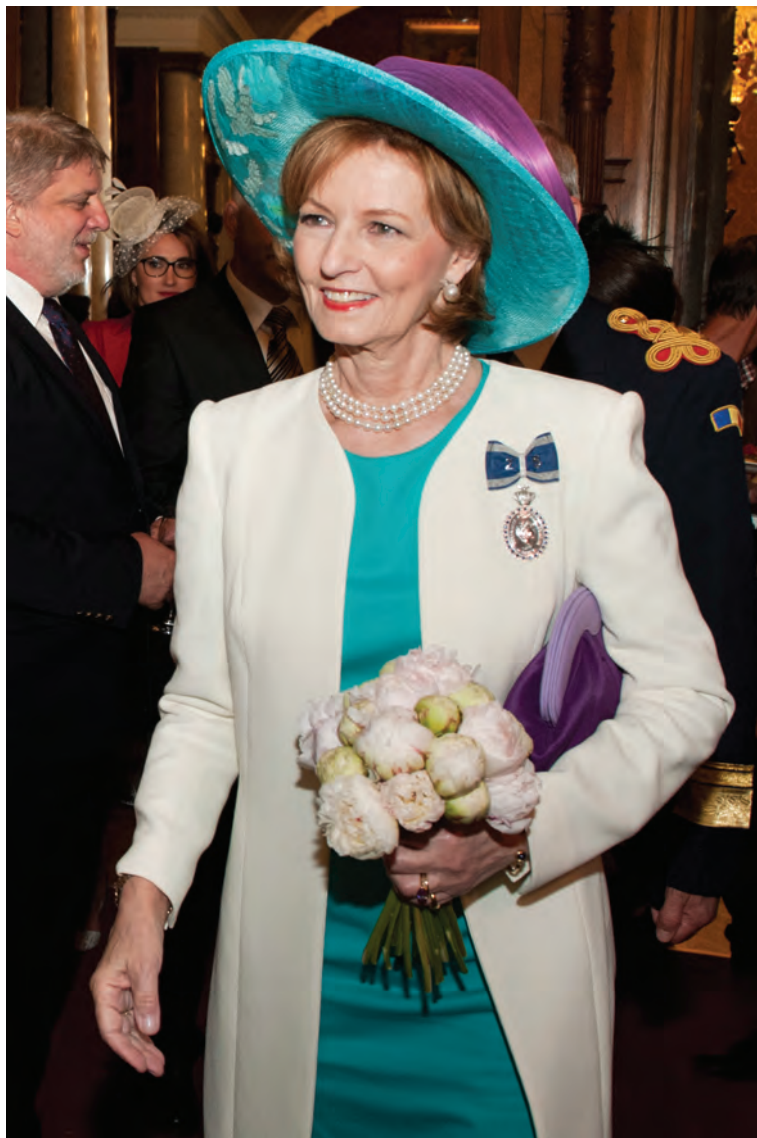
Garden Party la Castelul Peleş, 2016.