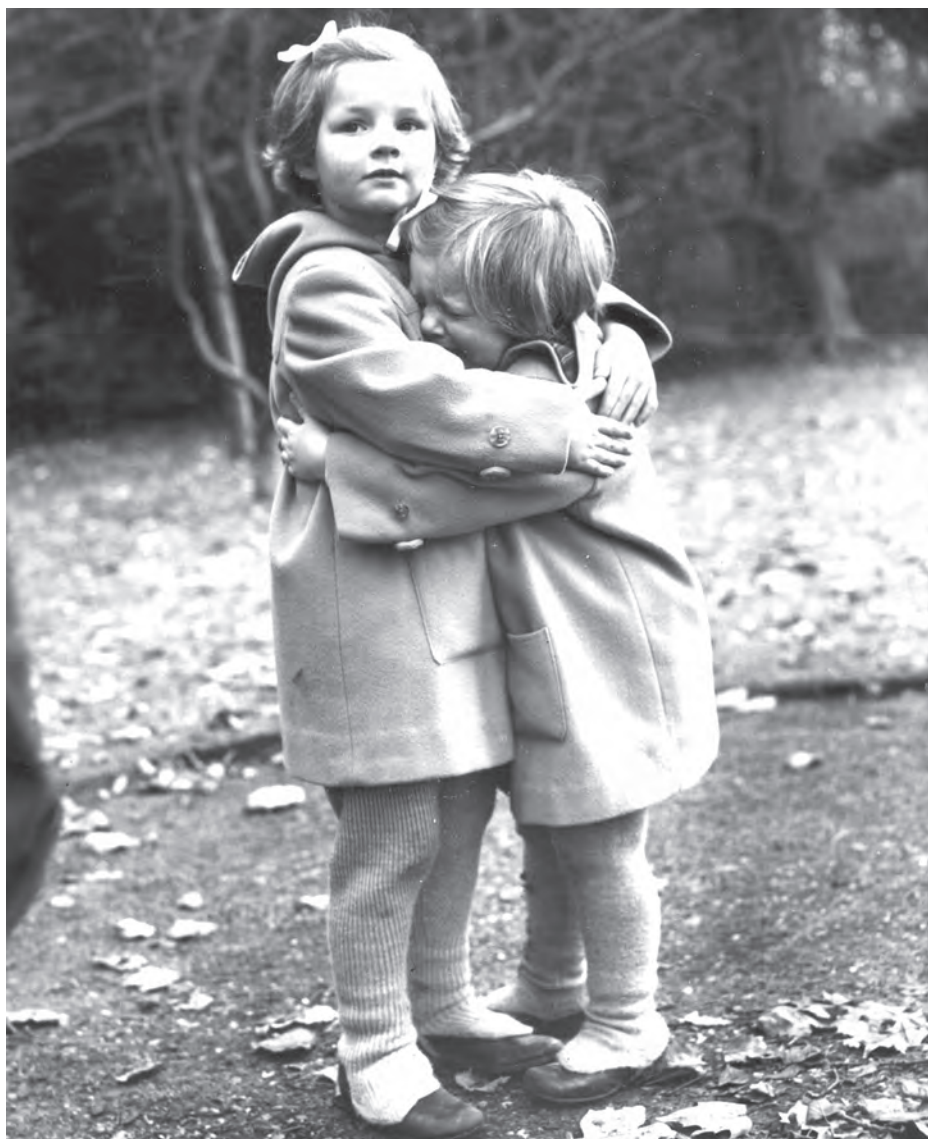
Majestatea Sa și Principesa Elena, Ayot St. Lawrence, Anglia, 1953–1954.