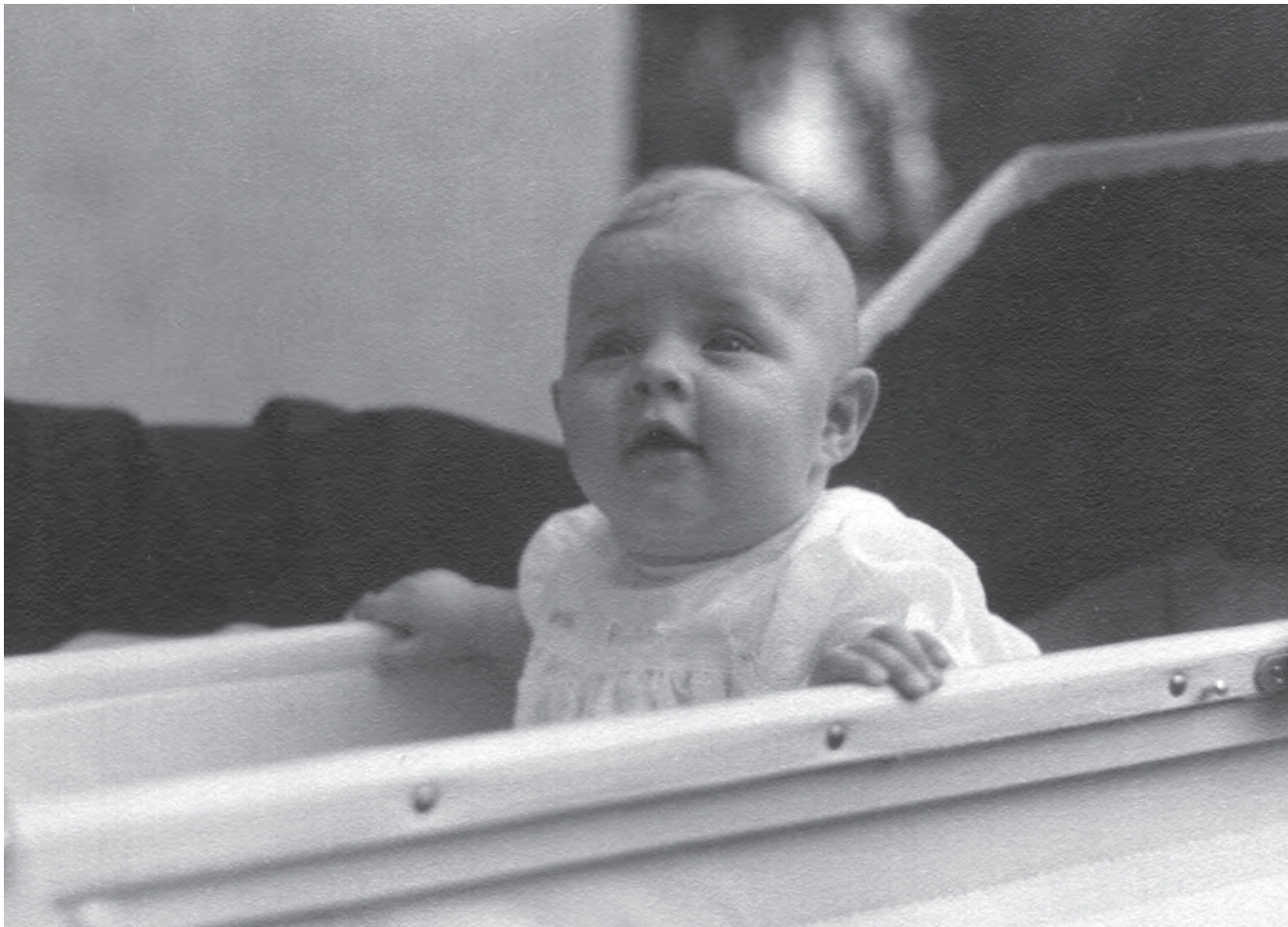
Fotografie din primele luni de viață ale Majestății Sale, realizată de Regele Mihai, 1949.