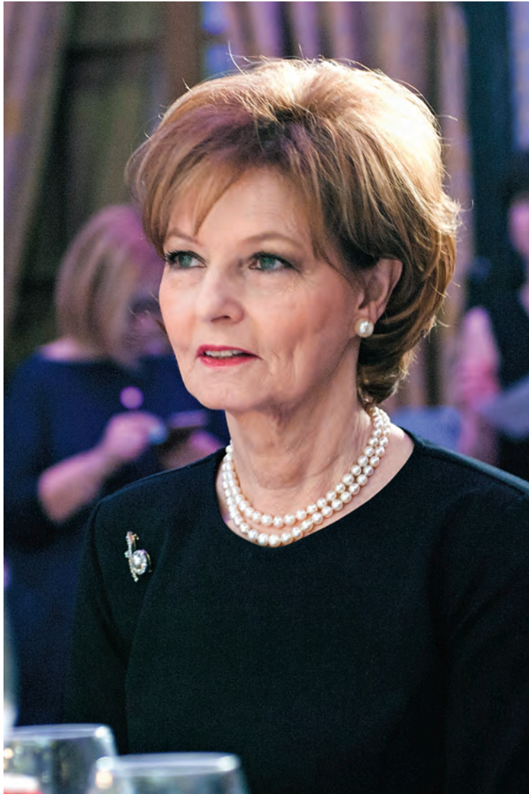
Gala Forbes Romania, 2016.