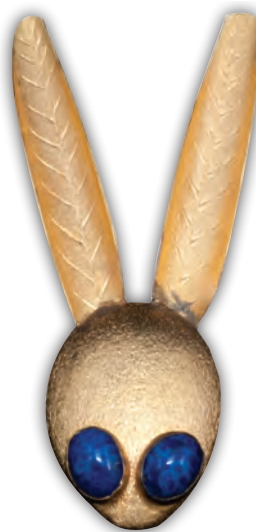
Broșă primită de Majestatea Sa de la bunica maternă, Prințesa Margareta a Danemarcei.

Având o viziune strategică și un simț al diplomației unice, Regina Maria a influențat prin faptele sale destinul istoric al României. Misiunea sa oficială de la Paris, prin care a sprijinit negocierile din timpul Conferinței de Pace de după Primul Război Mondial, a avut un rezultat excepțional din punct de vedere politic – formarea României Mari. Ca și predecesoarea sa, Regina Maria a îngrijit