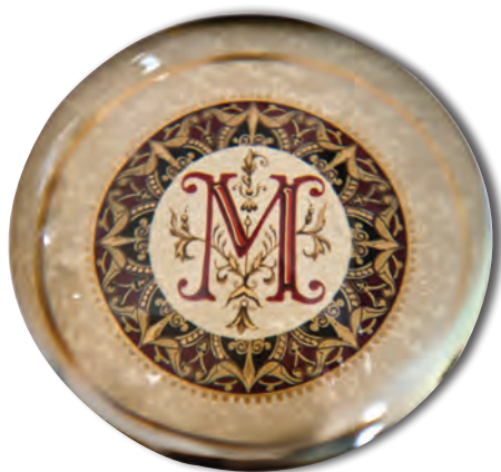
Prespapier aflat pe biroul Majestății Sale.

universitare, cât și după, Majestatea Sa Margareta a arătat o preocupare intensă pentru domeniul social, continuând astfel acțiunile inițiate de Elisabeta, Maria și Elena.