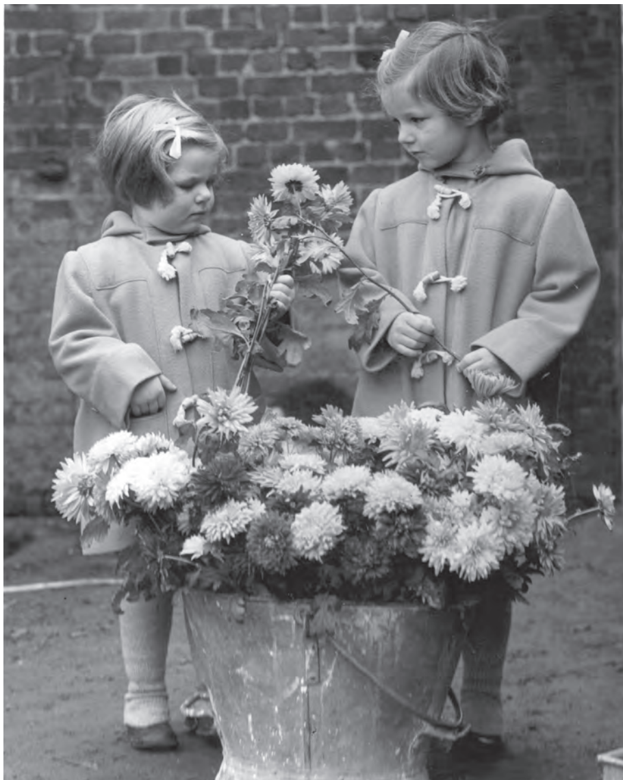
Majestatea Sa și Principesa Elena, Ayot St. Lawrence, Anglia, 1953–1954.