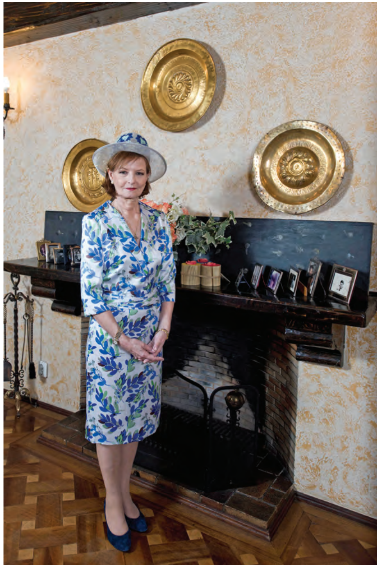
Garden Party la Palatul Elisabeta, 2017.