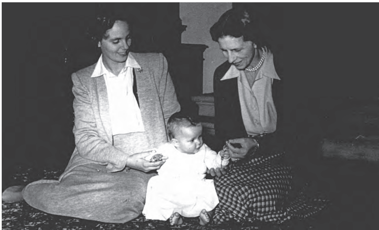
Principesa Moștenitoare în primul an de viață, împreună cu Regina-Mamă Elena și Regina Ana