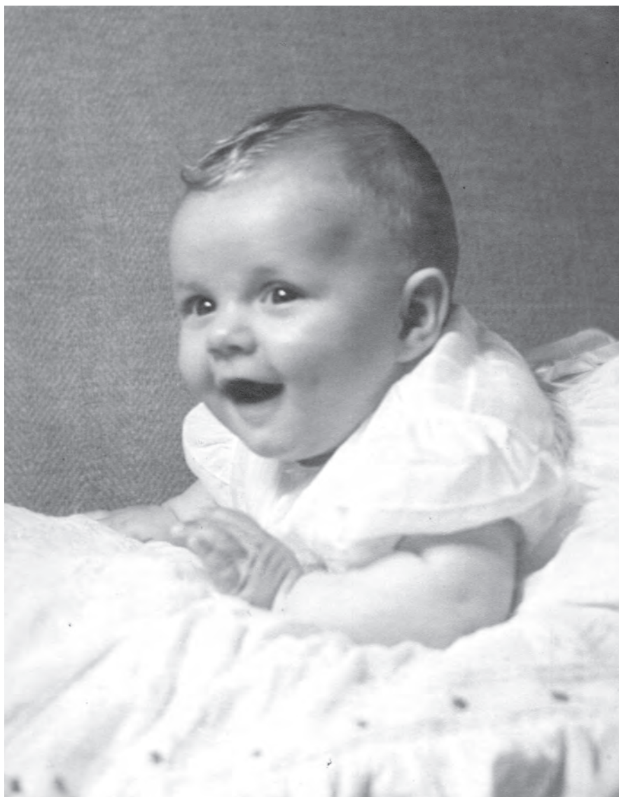
Una dintre primele fotografii ale Principesei Moștenitoare, 1949