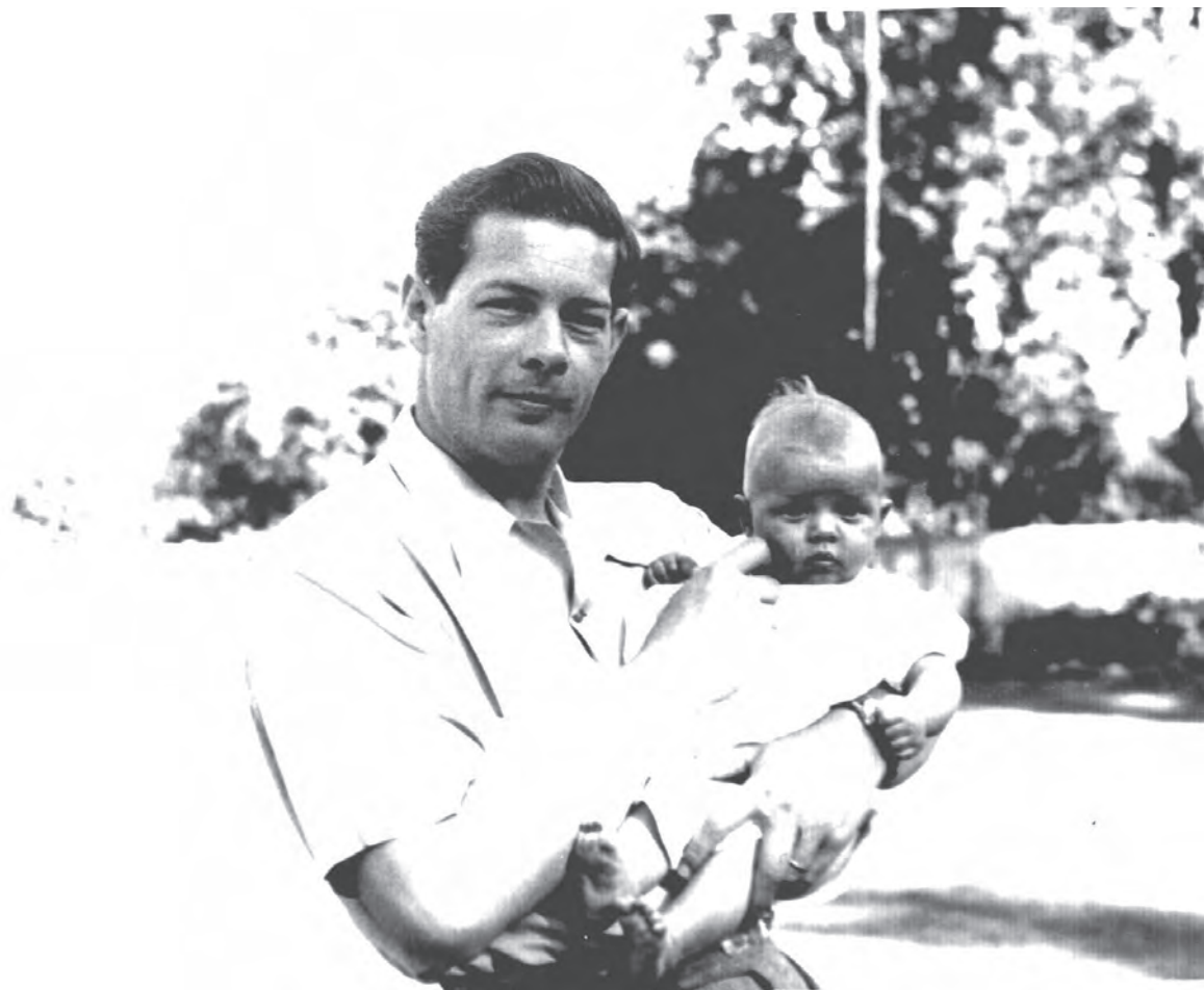
Principesa Moștenitoare și Regele Mihai, 1949