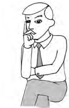
Îți pierzi vremea cu tipul ăsta!

Ca să ne demonstrăm teoria, iată un ansamblu tipic de gesturi de evaluare critică folosit atunci când o persoană nu este impresionată de ceea ce aude: