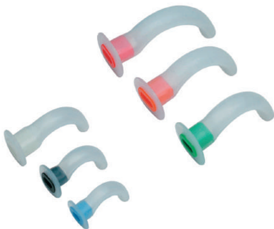
Figura 5. Pipă Guedel (sondă oro-faringiană)