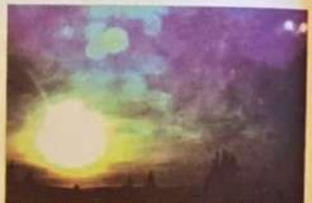
Fig.233 Recenta fotografie a unei „porți din cer” prin care soseau valuri de suflete nou aduse la „școala Terra”! (muntele Rarău – aug. 2011)