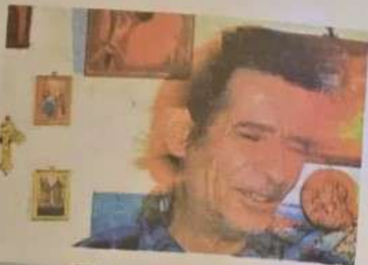
Fig.178 Altă ieșire limitată a capului eteric - la spate, asociată cu emisii roșii la frunte și la ochi. (Iași - 05.02.2005 -)