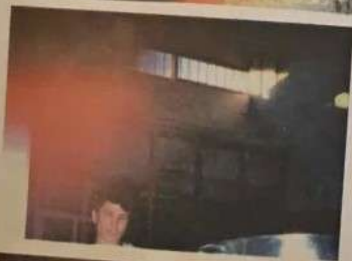
Fig.180 Frământările intime activează emisii nevăzute de materii eterice și astrale roșii, densificate deasupra capului. (Costinești - aug. 1998)