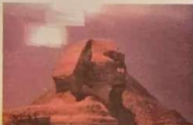
Fig.232 Dreptunghiurile radiante sunt portaluri ale „tunelurilor galactice” prin care au venit pe Terra „creatori” arhaici!(Egipt, Giseh – iulie 1996)