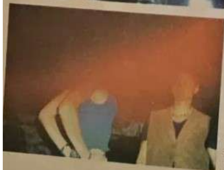
Fig.181 O ceartă aprinsă a generat un nor eteric și astral roșu, care a învăluit ambele persoane. (Costinești - aug. 1998)