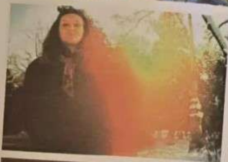
Fig.179 Stările emotive plăcute mai intense produc extinse emisii invizibile radiind în roșu. (Iași - ian. 1998 - colecție: Iuliana Chirvase)