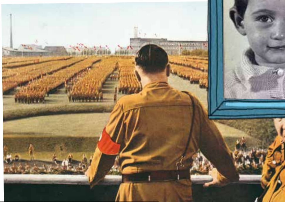
Adolf Hitler adresându-se susținătorilor săi la Dortmund (Germania), 9 iulie 1933.