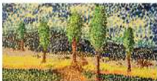
Peisaj [ http://szocs.eu/peisaj-pointilism/ ]

III. Știi că există tablouri realizate doar cu ajutorul punctelor? (tehnica pointilismului ). Desenează, folosind doar semnele de punctuație, portretul unui membru al familiei tale.