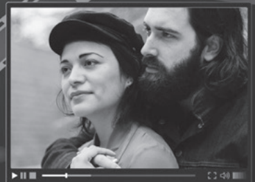
5 romantic film