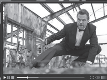
7 action film