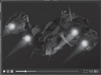
3 science fiction film

musical science fiction film -comedy- action film cartoon horror film romantic film fantasy film