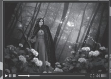
2 fantasy film