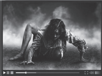
6 horror film