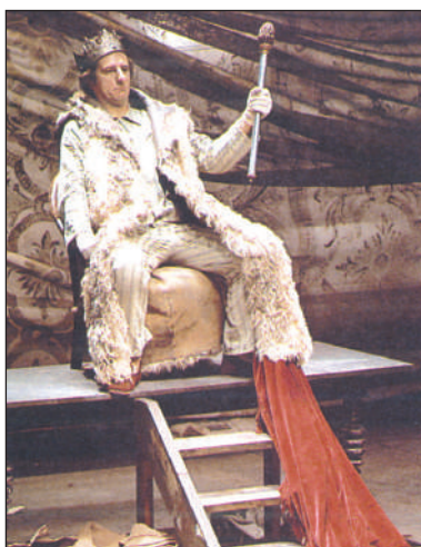
Le Roi se meurt a été monté en 1962 à Paris.

la bof génération — appellation métaphorique désignant, au début des années 90, les jeunes âgés de 15–25 ans qui se montrent apathiques et sans curiosité intellectuelle