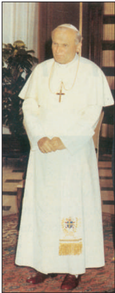
Le pape Jean-Paul II

Les expressions et les mots en italique représentent autant de marques lexicales du registre familier . Les trois rockers utilisent des expressions très imagées ("prendre son courage à deux mains" devient "prendre son courage à trois mains"), la syntaxe est simplifiée; peu de subordination, on préfère la juxtaposition. Très souvent, l'adverbe de négation "ne" est absent ("j'arrivais pas à comprendre pourquoi les autres étaient relax, alors que moi j'étais tendu", déclare Karl).