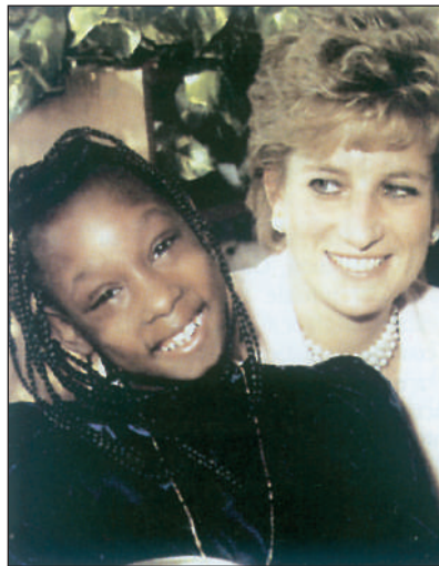
Lady Diana, championne des causes humanitaires

● Réagissez à la conclusion d'un journaliste du quotidien La Croix qui affirme ceci: