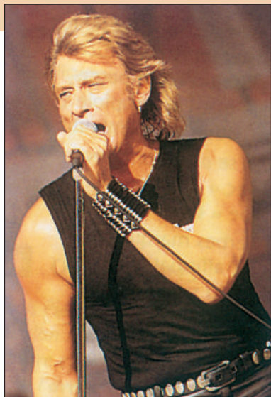
Johnny Hallyday — un vieux routier de la chanson française.