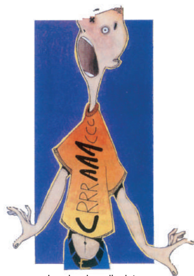
«Je crie, donc j'existe.»

→ je suis très âgé, il est temps que je quitte ce monde!