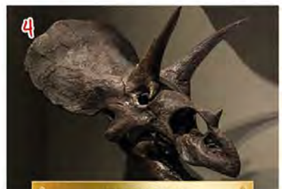
TRICERATOPS TRICERÁTOPS • TRICERATOPO 250 OS - BONES KNOCHEN • BEENDEREN HUESOS • OSSA