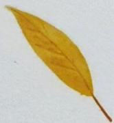
Frunză de salcie