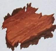
Scoață de copac