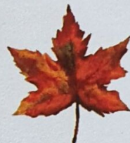
Frunză multicoloră de arțar