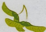
Semințe de arțar