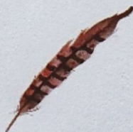
Pană de pasăre