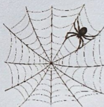
Pânză de păianjen