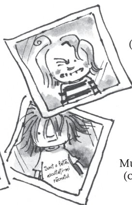
Muma Pădurii (clasa a III-a)