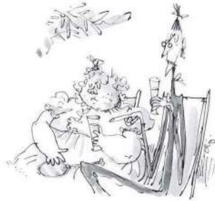
Mătușa Spiker & Mătușa Sponge